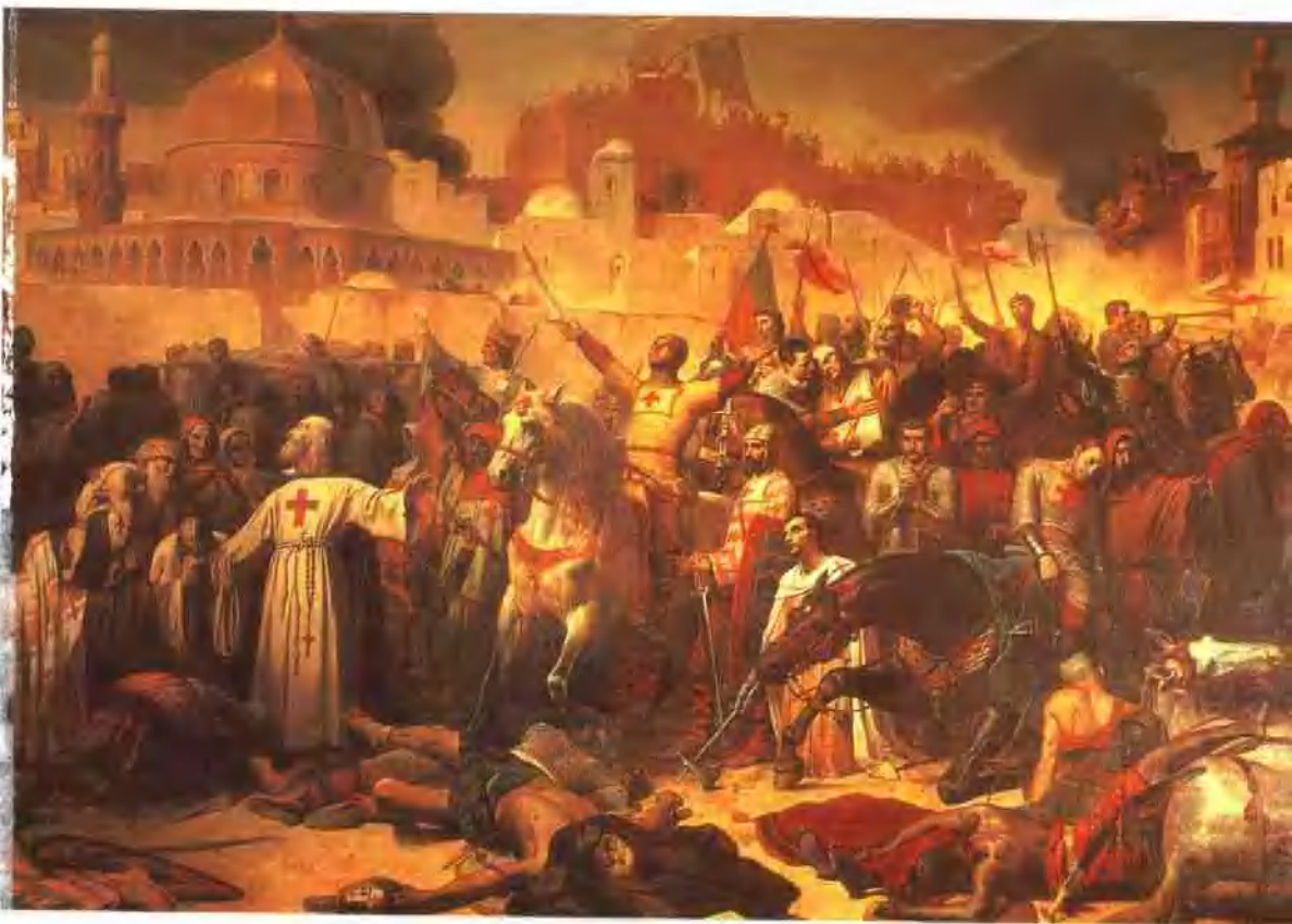
希尼奥尔的油画《耶路撒冷陷落》（19世纪）反映的正是本书开头的情景