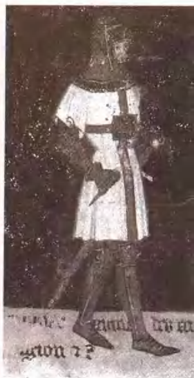
穿上盔甲准备打仗的骑士