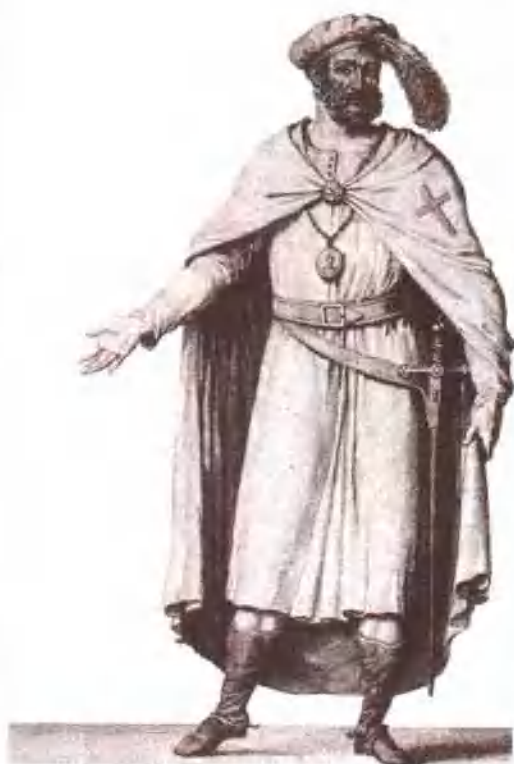
圣殿骑士团的总团长