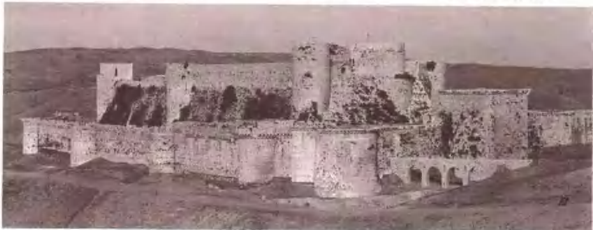
叙利亚残存的骑士堡