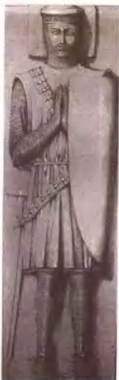
一位圣殿骑士的雕塑卧像