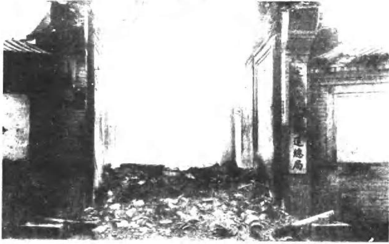
(二一) 张勳复辟失败后张勳在京私宅