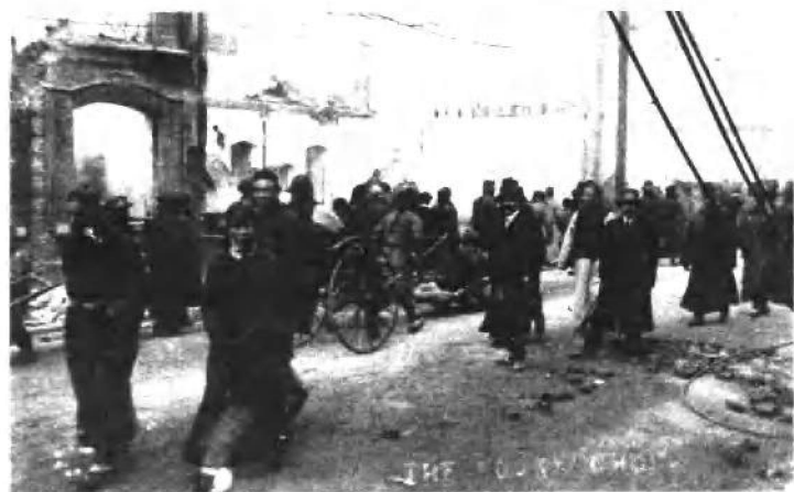
(十三) 壬子兵变北京的破坏