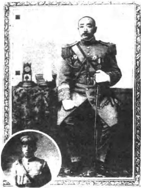
(九) 张作霖与张学良