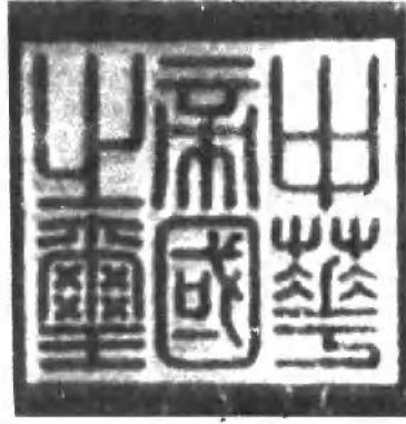
(十八) 洪宪帝制的玺印