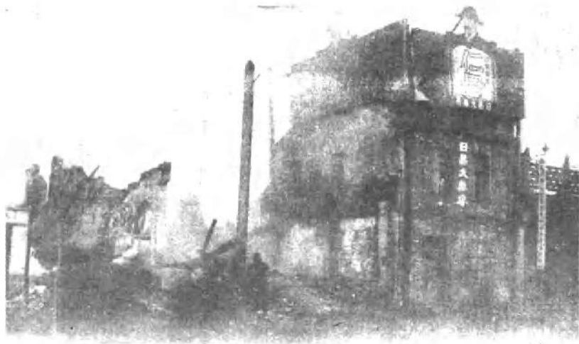
(十四) 壬子兵變天津的破坏