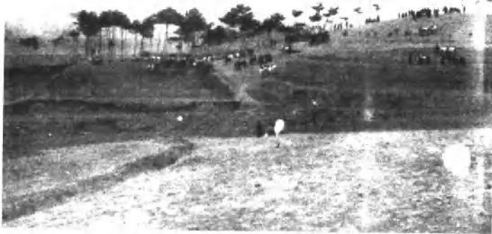
(二) 北洋新军野操阵地