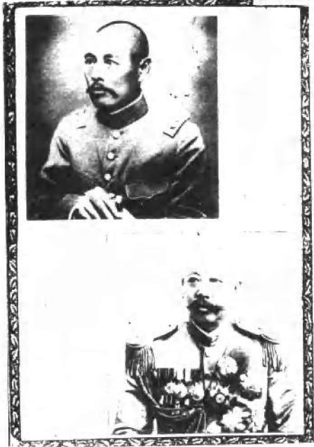
(八) 吴佩孚 (上) 与曹锟 (下)