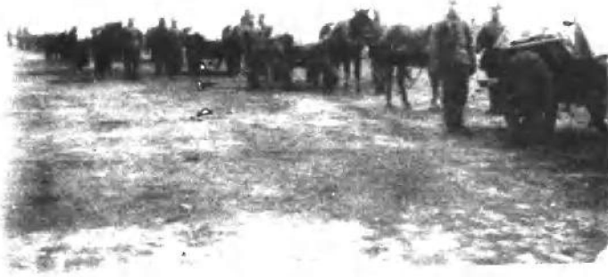
(三) 北洋新军辎重队运输