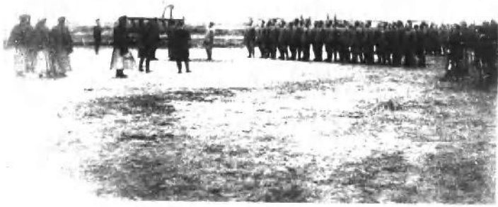
(一) 北洋新军器械体操