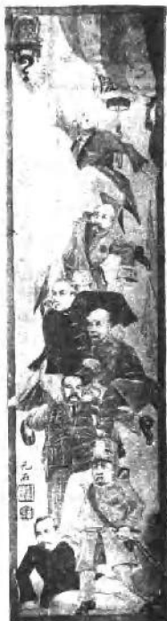
(十二) 十五年末元首竞争图