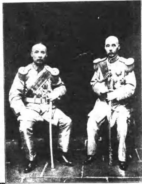
(七) 冯国璋 (右) 与 段祺瑞 (左)