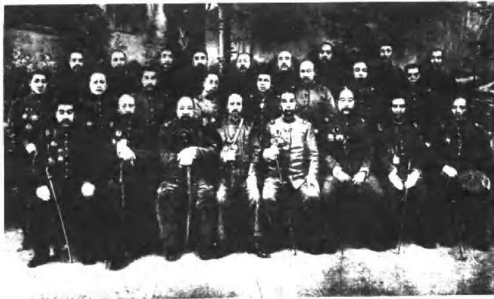
(十九) 1917年5月22日北京 督军团会议合影