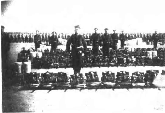
(四) 北洋新军工程队装备