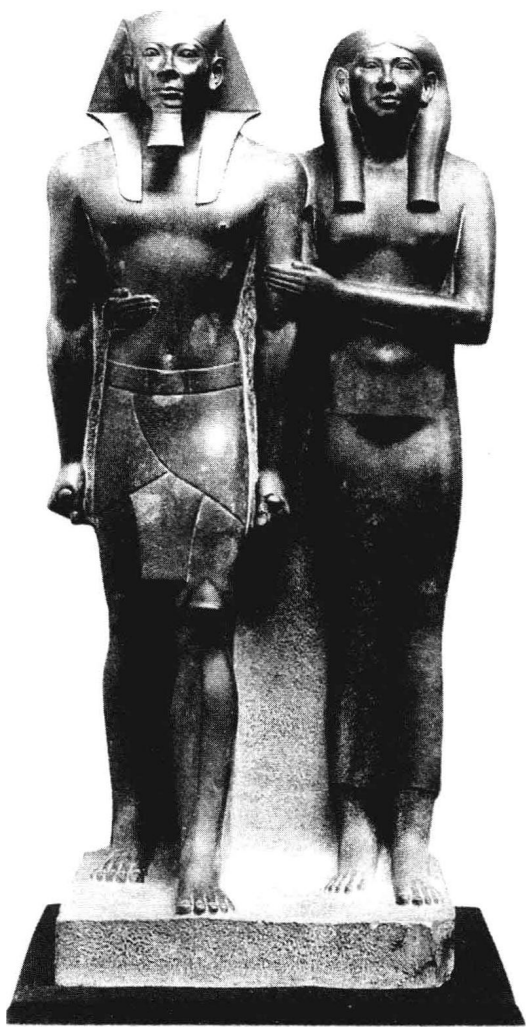
法老门卡乌和妻子立像

当然,建筑形式的发展随着神学的发展而变化。从古埃及墓室中发现的文字可以看出当时的人们相信法老们能沿着这些台阶登上