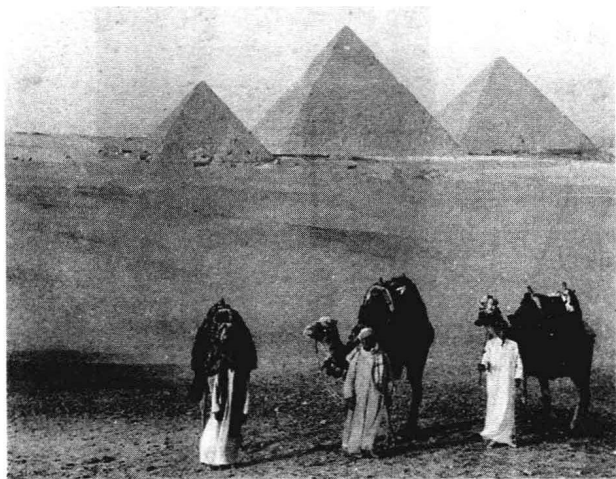
胡夫金字塔 吉萨高原的三座金字塔矗立在曾经绕塔而建的神庙和陵墓的废墟之中。

不过科学是永无止境的,历史在延续,人类的天性在于探索无限的未知世界,随着科学的发展,随着探索者们坚持不懈的努力和灵感的产生,金字塔之谜一定会真相大白,也许一个新的、不为人知的理论又摆在世人面前,也许又有更多的谜团不能解