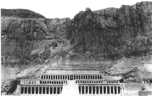
哈希普苏特女王陵墓实景图

“女王”这个名词在哈希普苏特时代的埃及语中根本就不存在,只有“王后”的称号,因为男性是王位的当然继承者。在埃及历史上也曾出现过几位有影响力的后妃,如风华绝代的妮菲媾迪王后就拥有一定的权力,并享