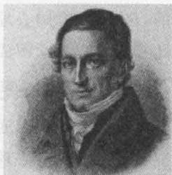
图 1-1 赫尔巴特

心理学一词来源于希腊文,意思是关于灵魂的科学。灵魂在希腊文中也有气体或呼吸的意思,因为在古代人们认为生命依赖于呼吸,呼吸停止,生命就完结了。随着科学的发展,心理学的对象由灵魂改为心灵。直到19世纪初叶,德国哲学家、教育学家赫尔巴特(Johann Friedrich Herbart)才首次提出心理学是一门科学。