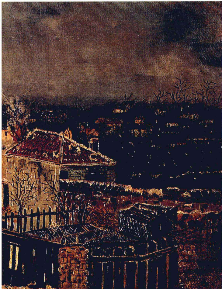
沙鞭之战 1882年 油画 画布 28×50cm 国立巴黎现代美术馆藏

亨利·卢梭，这位既不复杂，又不老练世故，更不会玩弄诡辩，被人以为绝对天真，完全不合当代艺术潮流，单纯、朴