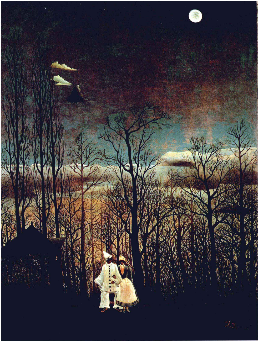
嘉年华会之夜 1886年 油画 画布 106.9×89.3cm 美国费城美术馆藏