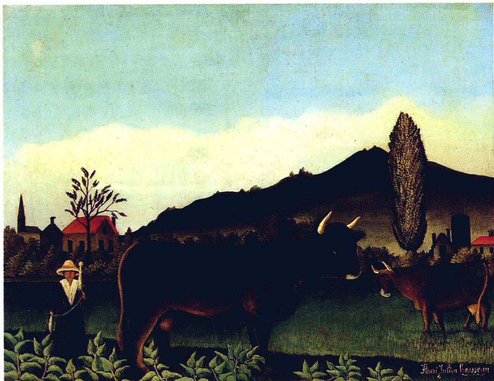
有牛的风景 1886年 油画 画布 51×66cm 美国费城美术馆藏

素，追求原始生命之美的画家，原是位“星期天画家”，直到四十九岁时才退休专心献身艺术。