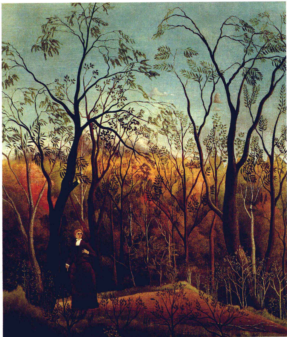
森林中的漫步 1886年 油画 画布 70×60.5cm 苏黎世市立美术馆藏 《森林中的漫步》局部(右页图)