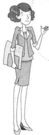
제니 브라운 珍妮 布朗