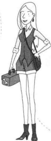
이리나 이바노브나 伊丽娜 伊凡诺芙娜