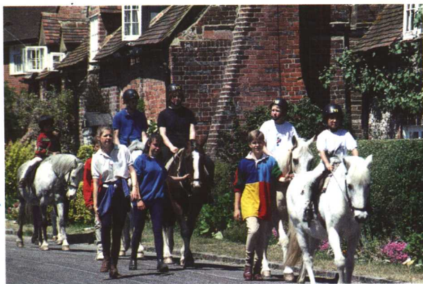
◁ 牛津郡乡下中学生的 的业余生活