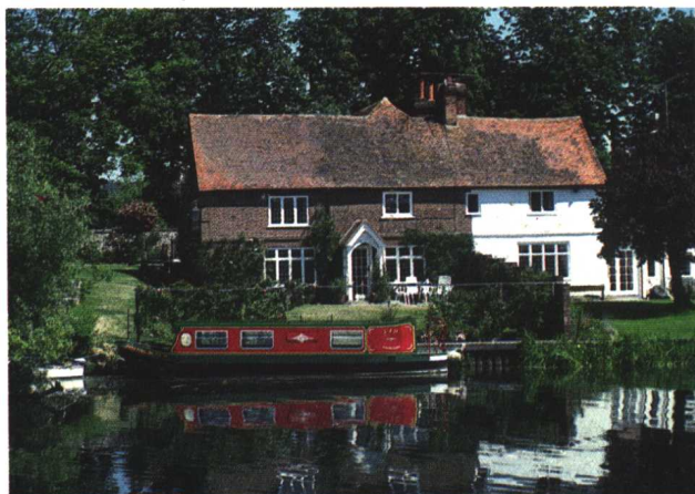
▷ 与闹市隔绝的 牛津郡乡下人家