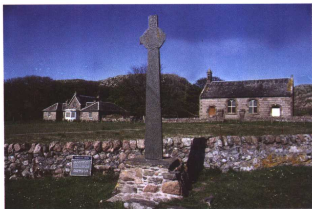
▷ 苏格兰地区伊奥 纳 (Iona) 小岛教堂