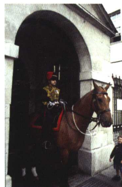
△ 白金汉宫的女王卫士