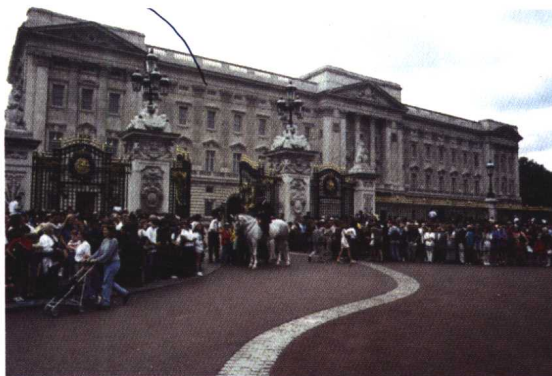
△ 白金汉宫——英国女王所在地