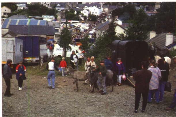
◁ 北爱尔兰乡村 的传统民族集市