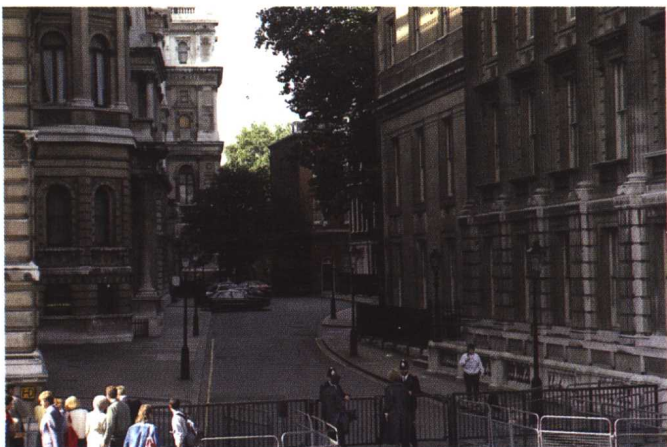
△ 英国首相府——唐宁街10号