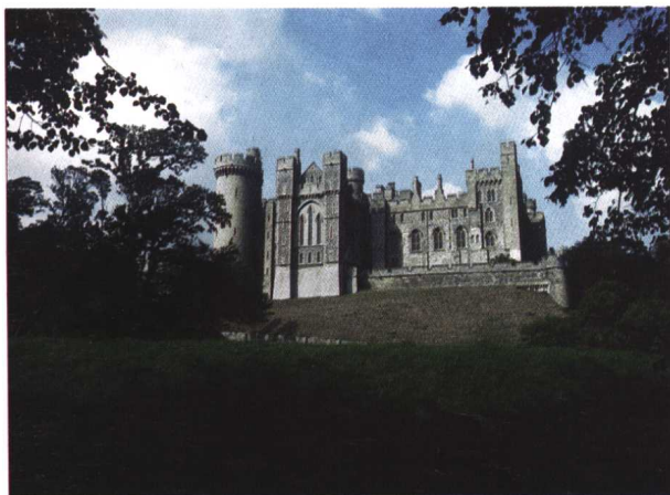
◁ 英国 11 世纪的古城堡