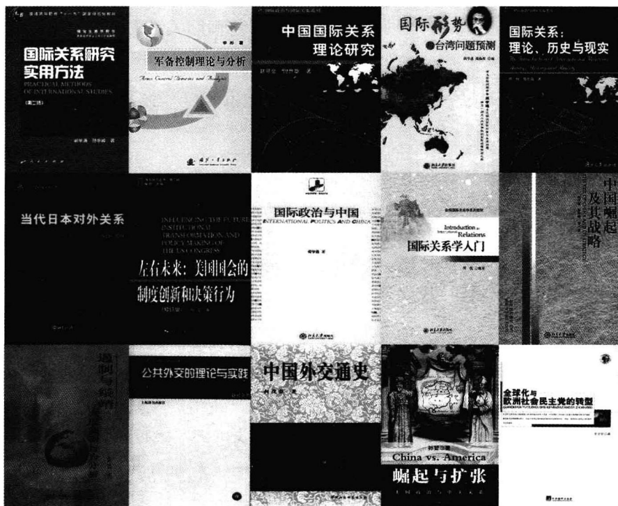
图片说明:清华大学当代国际关系研究院的部分学术专著和教材。