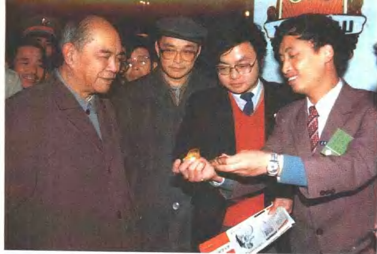
1987年10月，姚依林在全国打击假冒行为、保护名优商品展览会上。