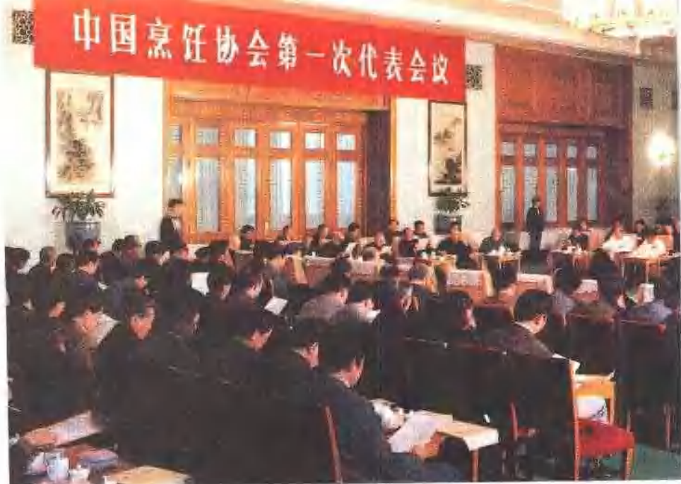
1987年4月，中国烹饪协会第一次代表会议在北京召开。