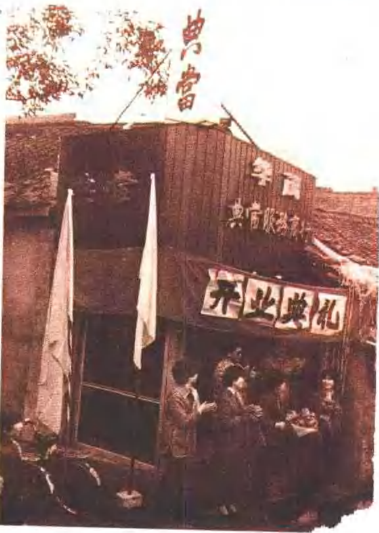
1987年12月30日，成都华茂典当服务商行开张营业。