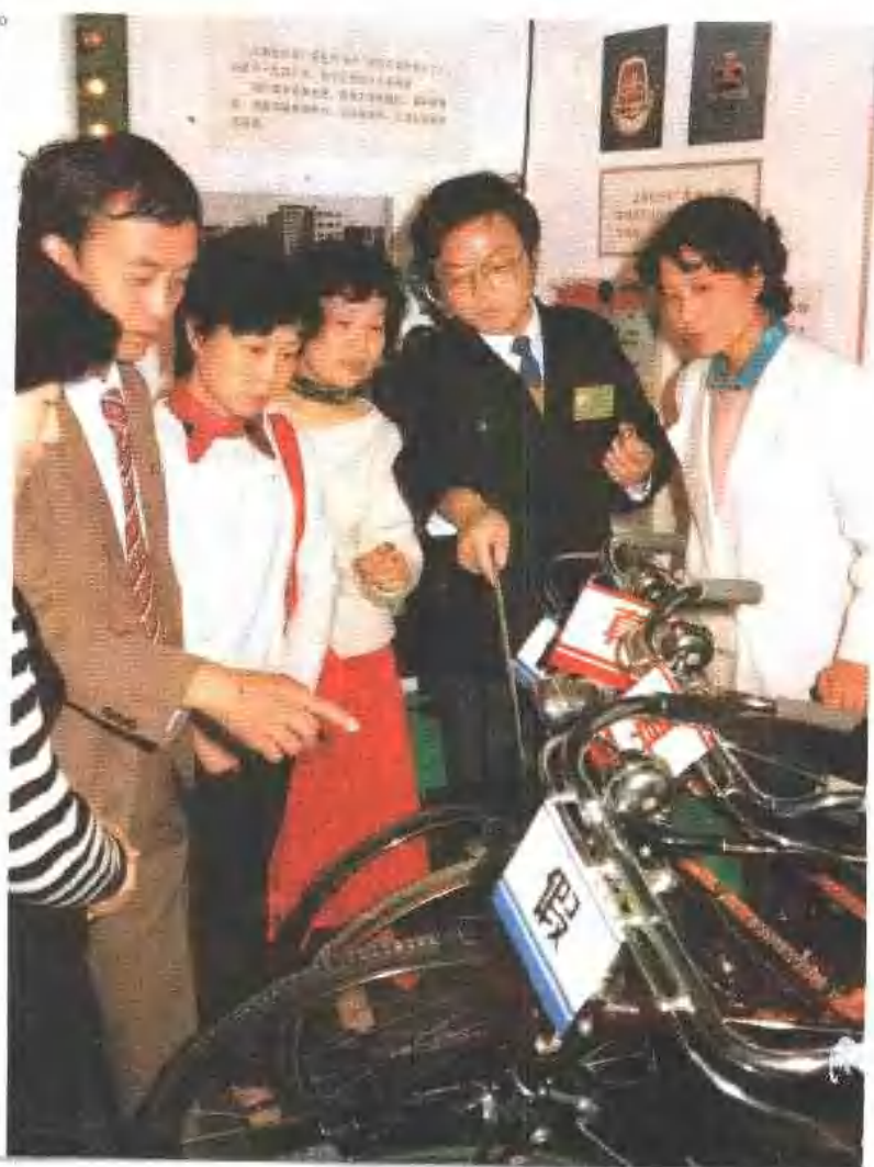
展览会工作人员向群众讲解如何区别真假“永久”牌自行车。