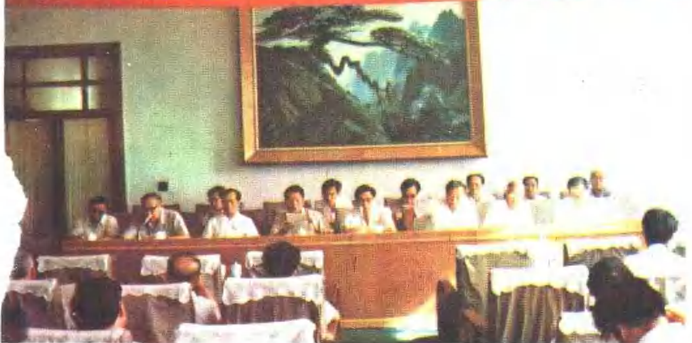
1987年7月，中国商业企业管理协会成立大会在沈阳召开。