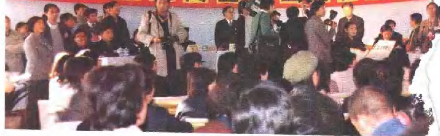
北京市海淀区小型商业企业拍卖大会会场。