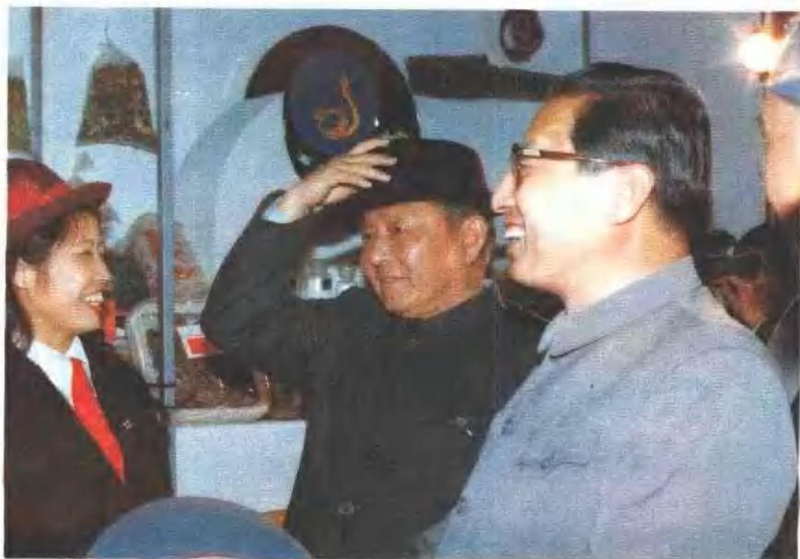
1986年1月，习仲勋、乔石参观全国供销合作社加工产品展览会。