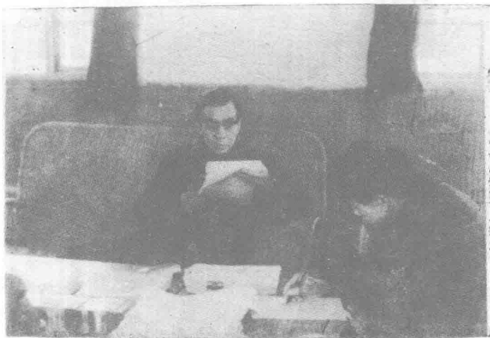
編輯們在整理資料