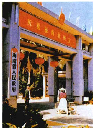
海南省人民政府新建筑的大门