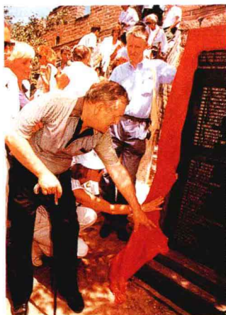
北京慕田峪长城一座石碑上刻着为修复长城捐款的中外人士姓名。这位旅游者在碑上找到了自己的名字。

1988年，北京市举办了中国旅游史上的第一个国际旅游年。年内全市共接待中外游客700万人次，其中海外旅游者120万人次，全市旅游创汇6.6亿美元，是1978年的12倍。北京国际旅游年期间，共举办了28项重大活动，天安门城楼首次对外开放后，全年登城参观人数达60多万人次，其中外宾9万多人，天安门管理处总收入800多万元。龙庆峡冰灯活动门票收入67万元。为期46天的北海龙灯会接待国内外游客250万人次，门票收入450多万元。