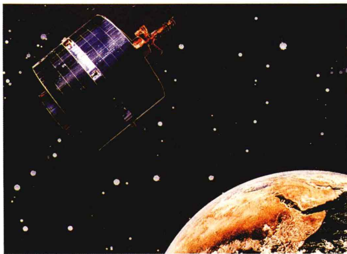
漫游太空的通讯卫星

7日20时41分我国发射了一颗实用通讯卫星，9日9时48分在地面站控制下卫星进入准同步轨道，22日13时02分准确定点于东经87.5度赤道上空。卫星上仪器设备工作正常。这颗卫星是由中国自行设计、制造的。与1986年2月1日发射的实用通讯广播卫星相比，它的性能和通讯容量有新的改进和提高。它是用“长征三号”运载火箭发射成功的第三颗地球同步轨道通讯卫星。这颗卫星的发射成功，标志着中国租星时代的过去和中国人民分享自己国家航天技术成果时代的到来。