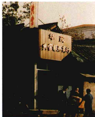
21日，中国第一家当铺在成都开业。

18日，国务院办公厅转发国家科委《关于科技人员可以业余兼职若干问题的意见》。《意见》指出，所有科技人员在完成本职工作的前提下可以在其他单位兼职，业余兼职可以由本单位安排，也可以由技术市场中介机构介绍或自行联系。业余兼职活动占用部分本职工作时间，或利用本单位物质条件和未公开的技术资料的，应经单位同意。单位可以从兼职收入中合理收取费用。