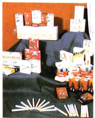
烟草行业跃居财政积累的第一大户