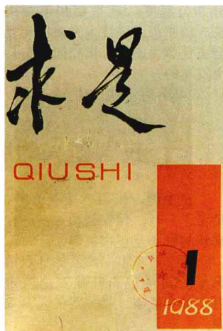
图为7月1日正式创刊的《求是》杂志

30日，中共中央作出委托中央党校创办《求是》杂志的决定。决定说，为适应改革开放新形势的要求，根据马克思主义的原理和原则，结合我国经济和社会发展的具体情况，开展理论上的探索和研究，促进马克思主义理论的新发展，中共中央决定委托中共中央党校创办全党的理论刊物《求是》杂志。总的指导思想：以党在社会主义初级阶段的基本路线为指针，全面地宣传一个中心、两个基本点，以改革总揽全局，防止僵化和自由化。