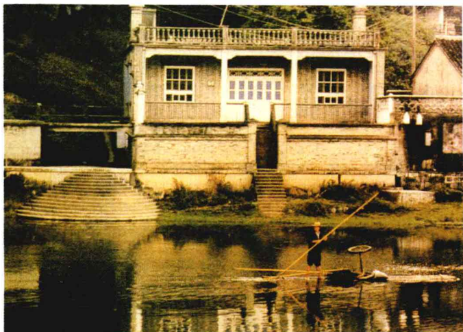
图为蒋经国先生的故居——浙江奉化县溪口镇剡溪小别墅。

会实现，并希望今后双方能经常交流诗艺。接着，《华夏诗报》副主编向明和台湾《蓝星》诗刊主编向明两个同名的诗人进行了对话。白桦对未能去台湾和许多诗友见面表示遗憾，向明也有同感，希望以后能在别的地方见面。洛夫希望两岸诗人携手，架起诗的桥梁，就是有惊涛骇浪也可以越过它。