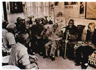
江西兴国县城北郊的红军村中剩下的七位红军老战士

除了历年转到地方各级党政领导岗位的老红军干部外，全军尚有红军时期入伍的干部近4300人。他们都是70岁上下的老人了，92%已经从各级领导岗位退下来。这些老同志经受过长期革命斗争的考验，为中国革命和建设作过重大贡献。在奔向四化的新长征中，他们仍在积极从事力所能及的工作，有的撰写回忆录，有的当校外辅导员，有的为群众行医送药，有的带领家乡人民治山治水，有的长年深入基层调查研究，有的站在纠正不正之风第一线。