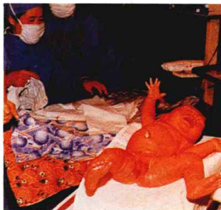
中国第一位试管婴儿降临人间

进行处理，去掉阻挠精子顺利穿透卵子的杂质，和卵子结合，在卵子受精并发生细胞分裂后，经阴道植入子宫腔。11天过后，经特殊检查证实获得了完全成功。