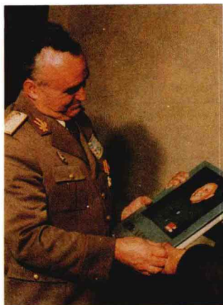
罗马尼亚军队最高政委书记伊·齐奥塞斯库中将在看英文版的《邓小平》画册。

26日下午在人民大会堂举行《邓小平》画册发行仪式。这本画册由中共中央文献研究室和新华通讯社编辑，中央文献出版社出版。编入画册的500多幅照片，是从数以万计的照片中遴选出来的，其中50%以上没有公开发表过。画册中还第一次发表了2万字系统介绍邓小平的传记性文章。画册通过照片和文字，反映了邓小平的革命业绩和理论贡献，展现出他在不同历史年代经历的胜利和曲折，构成一个以中国革命为背景的生动连贯的历史画卷。画册用中、英文出版。