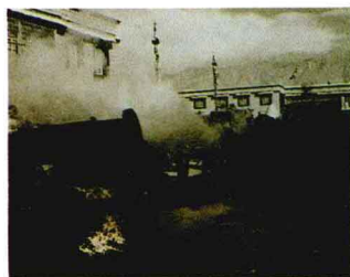
骚乱者点着了汽车

2月25日，西藏佛教界为庆祝藏历土龙年的到来，在拉萨大昭寺举行祈祷大法会。3月5日上午，在隆重邀请强巴佛环绕八廓街一周的仪式即将结束时，混在喇嘛里的100余名分裂主义分子在大昭寺南侧松曲热广场的讲经台上开始呼喊“西藏要独立”等口号。接着，几千名追随者开始绕八廓街游行。他们冲击传昭办公室、砸毁西藏电视台的转播车、采访车及消防车、小轿车等，抢劫和烧毁个体户的财产，同时向群众和公安、武警人员投掷石块。骚乱一直持续到深夜才停止。在这次事件中，武警战士袁石生被骚乱分子用刀刺成重伤后推下楼而牺牲。330多名