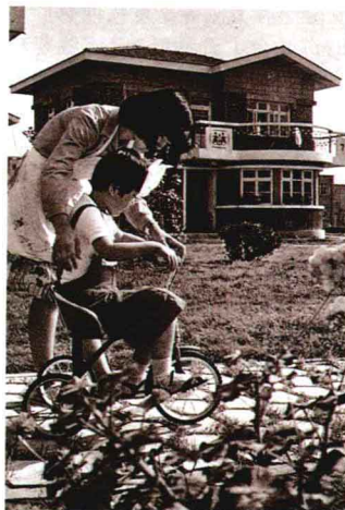
天津 SOS 儿童村中，24 岁的“妈妈”带小女儿在家门前练车。

17日，中国残联、中国残疾人福利基金会、中国康华发展总公司、北京市民政局和北京市残联在京联合举办了首次“残疾人活动日”活动。一些演出单位举行了义演。首都许多电影院也举行了专场义演；国家和北京市的运动队举行了义赛；美术界举行了义展；首都医学界的100多名著名专家、教授除开展义诊活动外，还走上街头，开展残疾人预防义务宣传、咨询活动；商业系统组织了义卖活动等。数千名中小学生到一些残疾人所在的福利工厂和残疾人家庭，为残疾人做了大量缝补洗涮等好事。首都的残疾人也踊跃开展了“残疾人为社会”的活动。