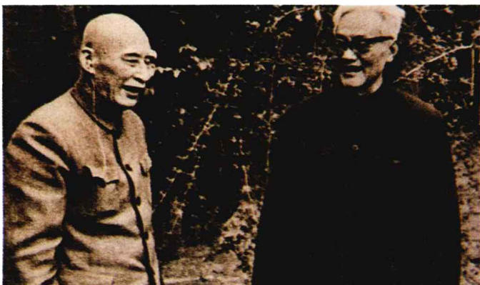
叶圣陶（左）与巴金在一起

文、新诗、童话等。还与刘延陵、朱自清、俞平伯等创办了我国新文坛上第一个诗刊《诗》，并出版了我国第一个童话集《稻草人》以及小说集《隔膜》、《火灾》等。叶圣陶为我国教育事业倾注了毕生精力，他从事教育和教学工作70多个春秋，写出了大量有关教育、教学的专论、专著和书简。