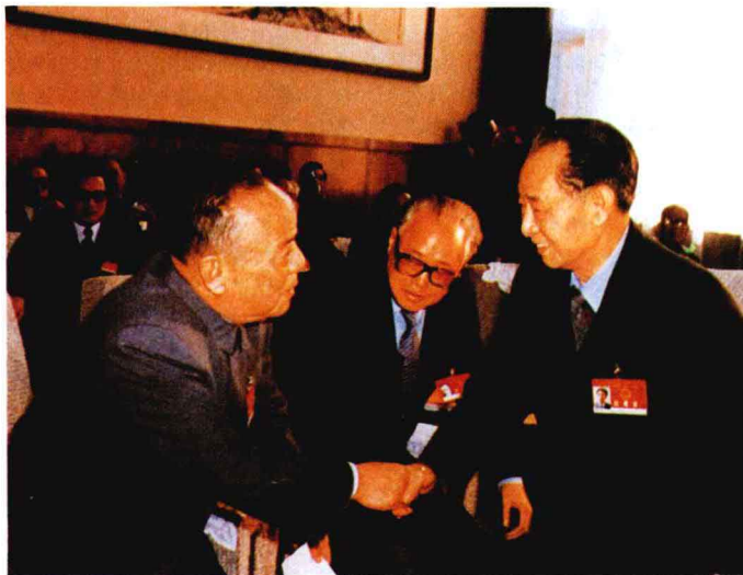
杨尚昆同前中央总书记胡耀邦握手问候

举和决定了新一届国家机构领导人。大会选举杨尚昆为中华人民共和国主席、王震为副主席；万里为全国人大常委会委员长、习仲勋等19人为副委员长；邓小平为中央军委主席。大会根据国家主席提名，决定李鹏为国务院总理，姚依林、田纪云、吴学谦为副总理；李铁映等9人任国务委员。根据中央军委主席提名，决定赵紫阳、杨尚昆为中央军委副主席。