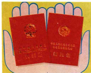
两会代表证委员证

政协第七届全国委员会第一次会议于3月24日至4月10日在北京举行。六届全国政协副主席钱学森向大会作了政协第六届全国委员会常务委员会工作报告，肯定了5年来全国政协把发挥政治协商、民主监督的基本职能作用作为中心环节，把事关国计民生的重大问题作为政治协商、民主监督的主要内容，并逐步向经常化、制度化的方向发展，效果显著。会议期间，委员们就当前人民群众迫切关心的物价改革、工资改革、新闻工作改革、社会风气、文化教育事业等问题纷纷发表意见，表现了参政议政的积极性。会议选举李先念为第七届全国政协主席。