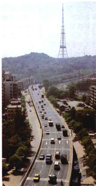
广州环市路的高架路

1985年到1986年，上海公交公司反复比较了3家外国汽车公司的价格之后，用100万元购进100辆“阿尔加”旧公交车，连同各种费用共用150余万美元。而广州公交公司则由欲在车身上做广告的外商出资220万港元，进口了22辆双层公交车，免费供公交使用，做的是“尤伯罗斯”式无本万利大买卖。