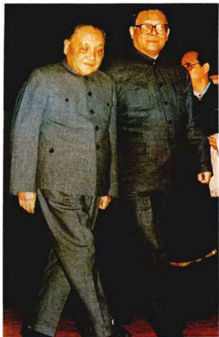
2月，邓小平和江泽民在上海。