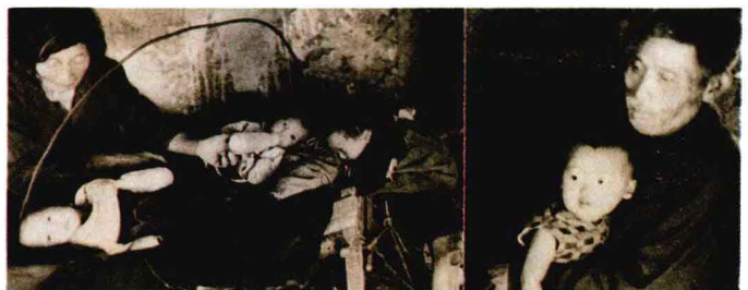
浙江金华一对善良的老夫妇靠拣破烂为生，却收养了许多弃婴，引起社会广泛关注。