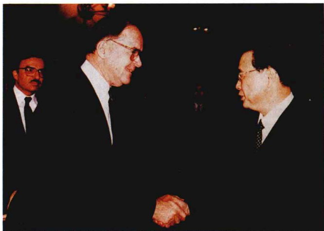
1988年3月，中国总理李鹏在会见世界银行行长科纳布尔时表示，希望中国与世界银行的合作能继续得到发展。

“人工种子”出现，可以大量地迅速地繁殖各种植物。如一粒稻谷种子的胚状体经过培养，即可获得千千万万个人工种子。这一研究成果表明，传统的种子生产方式将会发生重大的变革。