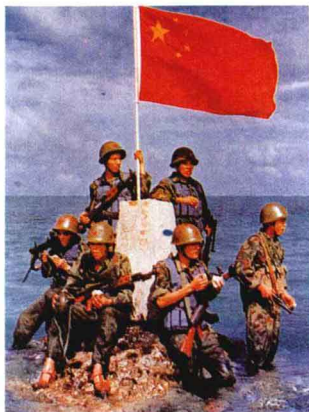
守卫南沙群岛的卫士们

14日，越南海军的两艘运输船和一艘登陆舰的43名武装人员强行登上中国南沙群岛的赤瓜礁，不顾中国海军要其离礁的喊话，首先向礁上中国海军考察人员开枪。与此同时，越军舰船也一齐向礁上和停泊在附近海面的中国海军舰船射击和开炮。中国海军忍无可忍，被迫进行自卫还击。战斗持续了28分钟，越军一艘运输船被击沉。另一艘运输船和登陆舰被击成重伤。事件发生后，中国海军本着人道主义精神，救起越军9人，并允许越南船只悬挂红十字旗帜前来营救。