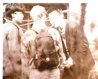
“有没有外汇？”——街头一景

19日，以石家庄市造纸厂为龙头的“中国马胜利造纸企业集团”在石家庄市宣告成立。参加这个集团的第一批28个厂家，除石家庄市造纸厂是盈利企业外，其余厂家绝大多数是亏损厂和微利厂。造纸企业集团坚持自愿、平等、互利的原则，采取集体承包的形式发展成员厂家。马胜利被推选为董事长兼总经理，作为集体承包的法人代表。集团采取总经理向各地政府直接承包微利、亏损中小企业的办法，包进来，包下去，层层承包，逐步扩大。