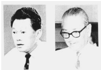
1965年8月9日，我和东姑阿都拉曼分别宣布新马分家。