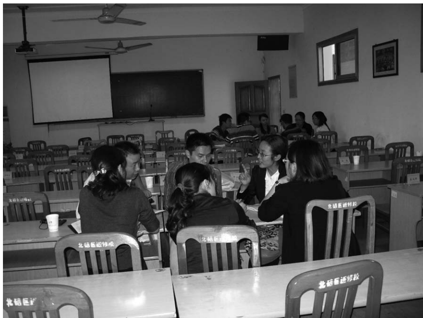
学员分组讨论新课标

回忆起来,那时候我的想法是比较粗浅的。当时我想,自己曾经上过“小数的初步认识”公开课,组长安排我再上“认识小数”,可能差不多,于是一口答应下来。然而,年段不同,教学目标也就不同了。认真研读新课标,整体把握教学目标,有效实施教学活动,是在今天的学习中,认真反思自己以前的教学才得到的体会。梳理完问题,理清了思路,我想我将能更准确地定位学段目标,更有效地实施课堂教学。