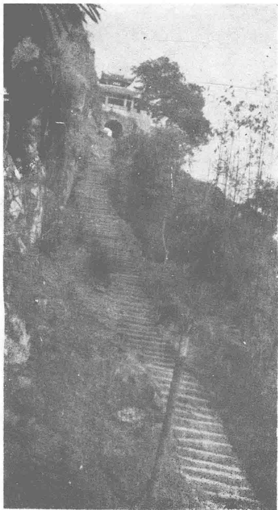
◀ 合川钓鱼城护国门