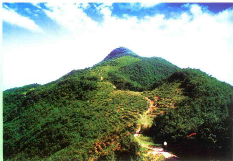
楚国发祥地——主山寨

中武当又名“九龙观”，始建于明嘉靖年间，是一处历史悠久的道教圣地。每年正月初九庙会期间，游人数万，川流不息，比肩接踵。