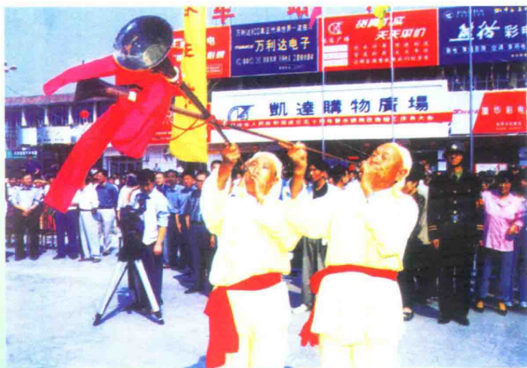
发源于先楚的“巫音”在南漳风韵犹存