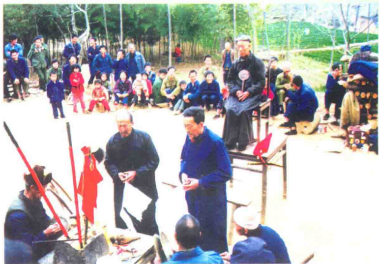
遗存于南漳的楚人“端公舞”引起国际关注