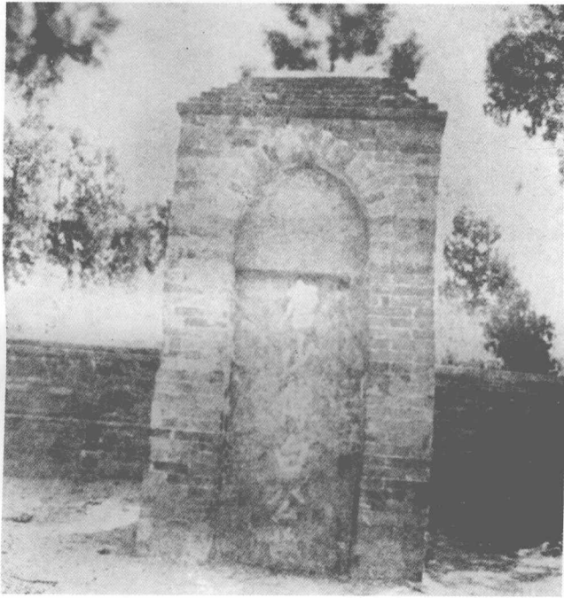
洛陽龍門香山白居易墓