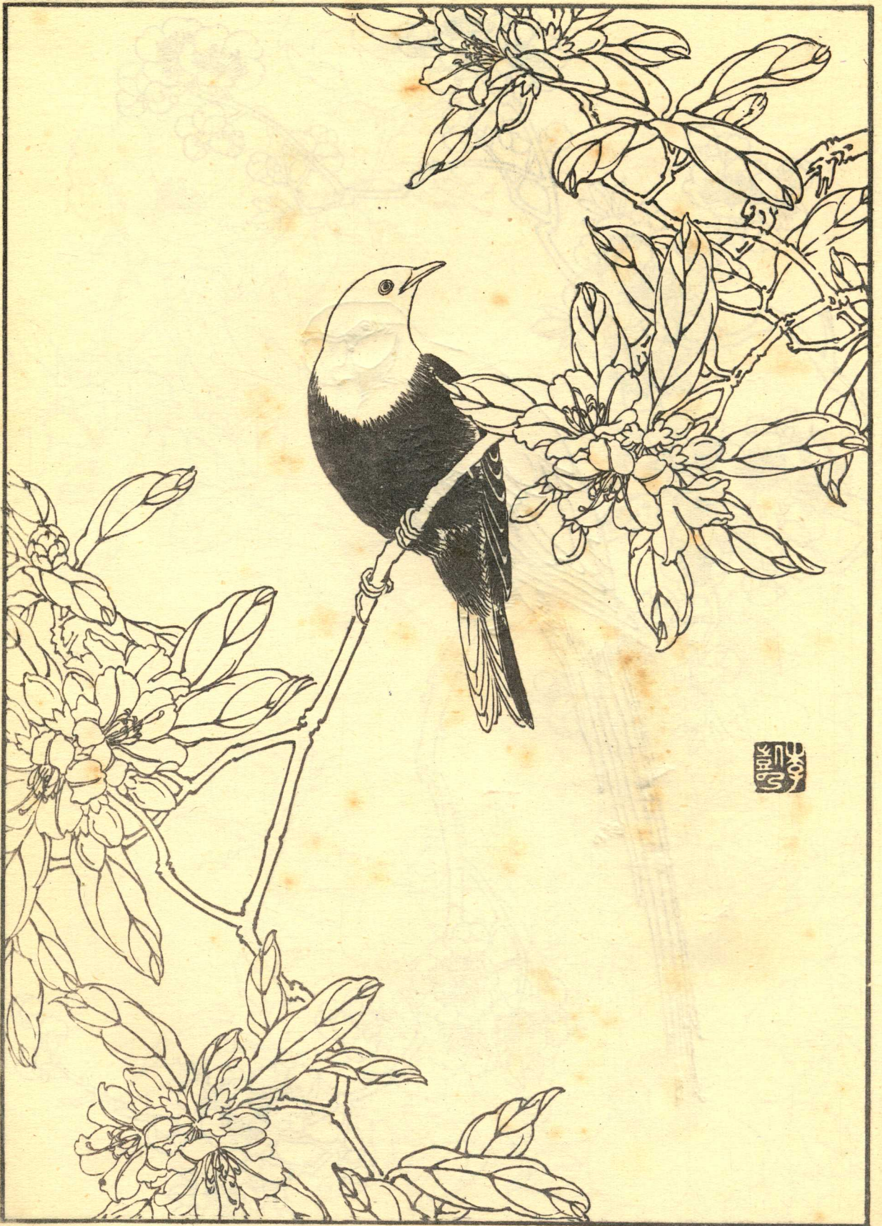
五、石南花、白头黑鹀