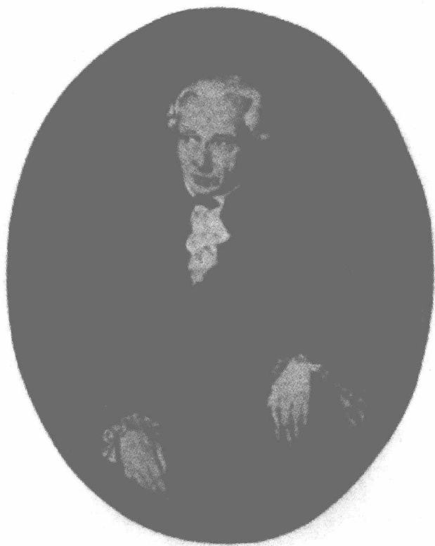
批判哲学的巨人——康德