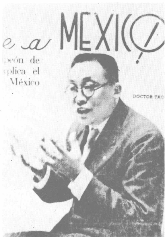
一九三七年，陶先生在墨西哥宣传抗日救国。