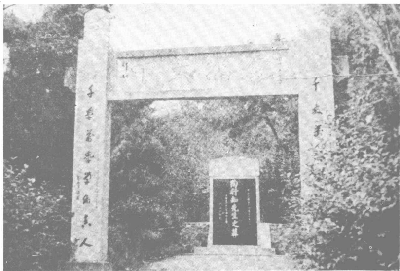
座落在南京劳山下晓庄的陶行知先生墓。