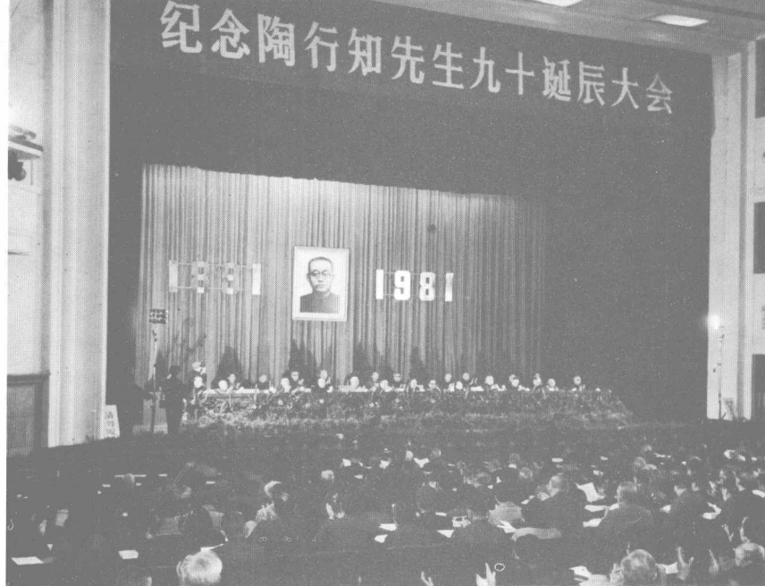
今年十月十八日在北京全国政协礼堂举行大会纪念陶行知先生九十诞辰。邓颖超同志主持大会并讲话。图为纪念大会会场。