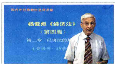
▲北京大学杨紫炬教授