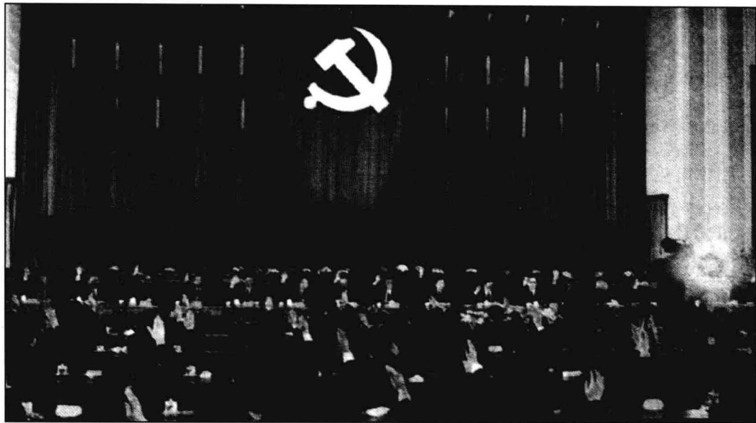
◎ 中共十五届二中全会会场。

道路”。更引人注目的是，在世纪之交，随着世界局势发生重大变化，世界上有影响的一批大党、老党纷纷丧失政权。美国等发达国家利用其先进强大的传播手段继续向全世界推行它们的价值观念和政治观念，各种思潮互相冲突，世界上意识形态领域的较量仍然十分尖锐和复杂。中国面临着西方发达国家政治军事等方面占优势的巨大压力。