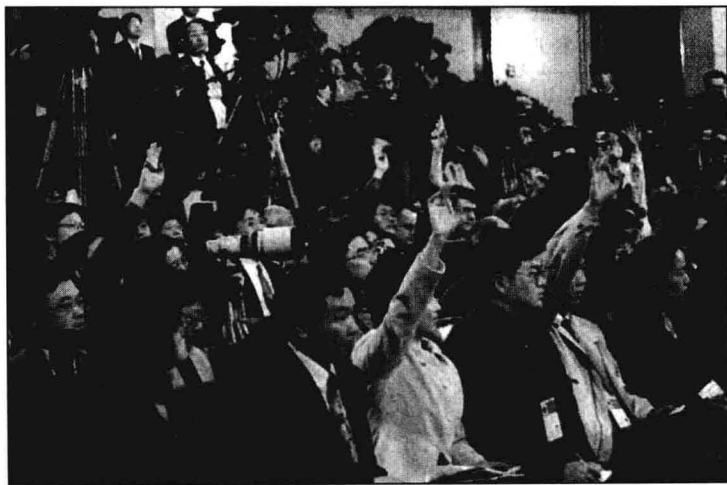
◎ 1998年3月19日，九届人大一次会议举行记者招待会，中外记者踊跃提问。

从国内看，中国社会主义现代化建设取得举世公认的突出成绩，综合国力大大加强，人民生活上了一个大台阶。首先是国民经济持续快速健康发展，人民生活总体上达到小康水平。中共十五大以来，面对来势凶猛、席卷东南亚各国，并迅速波及日本、韩国、俄罗斯以及拉美等国的亚洲金融危机，以及世界性经济波动带来的严重影响，中共中央和国务院沉着应对，积极实施扩大内需的方针，适时采取积极的财政政策和稳健的货币政策，保持了经济健康较快增长。这时期国家经济结构战略性调整取得成效，农业的基础地位继续加强，传统产业得到提升，高新技术产业和现代服务业加速发展。建设了一大批水利、交通、通信、能源和环保等基础设施工程。西部大开发取得重要进展。经济效益进一步提高，财政收入不断增长。“九五”计划胜利完成，“十五”计划开局良好。城乡居民收入稳步增长，城乡市场繁荣，商品供应充裕，居民生活质量提高，衣食住行都有较大改善，“八七”扶贫攻坚计划基本完成，社会保障体系建设成效明显。