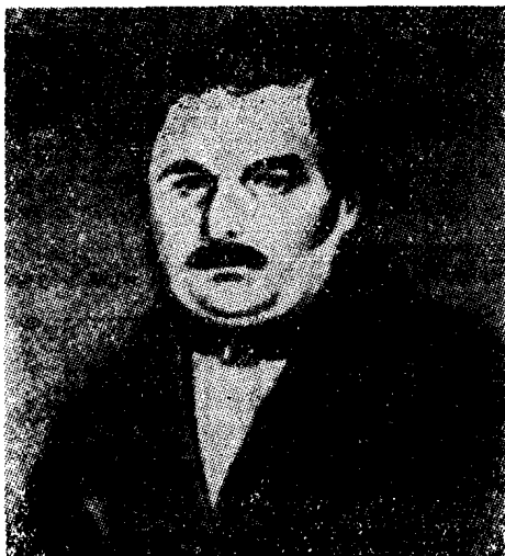
果戈理的父亲华西里·阿 法纳西耶维奇·果戈理

童年时代的果戈理常常喜欢和祖母作伴。他的祖母也是一位颇有教养的妇女。她熟悉古代的查波罗什哥萨克的历史，会讲许许多多民间的故事，还会唱民歌。每当夜幕降临以后，这位慈祥的老祖母总喜欢把小孙孙拉到膝前，给他讲一些有趣的故事。有时候，小果戈理简直被这些神怪故事迷住了。为培养孙子对艺术的兴趣，老祖母还亲自教他学绘画，并教他学会了許多民歌。