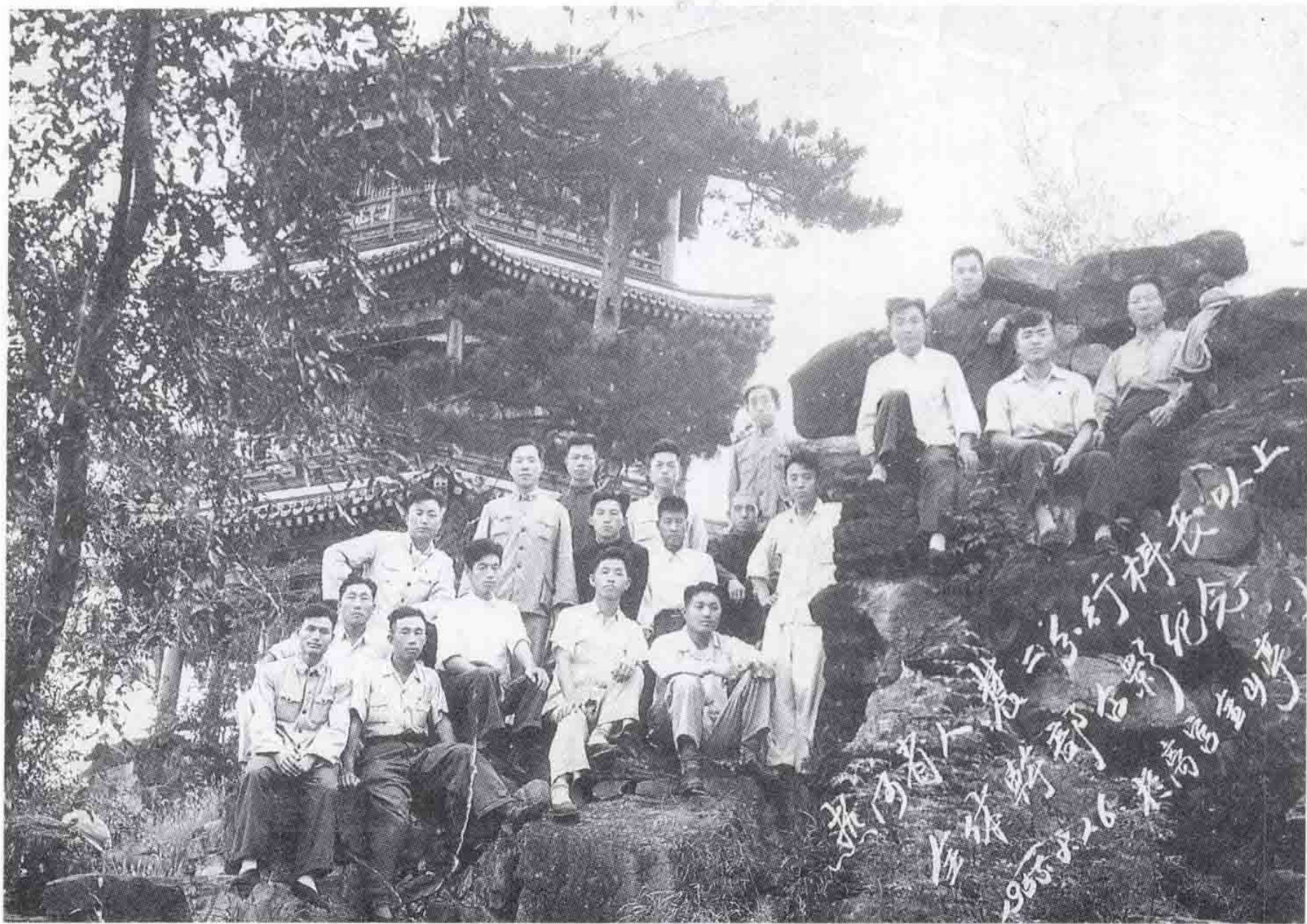
热河省分行科级以上干部合影（1955、8）