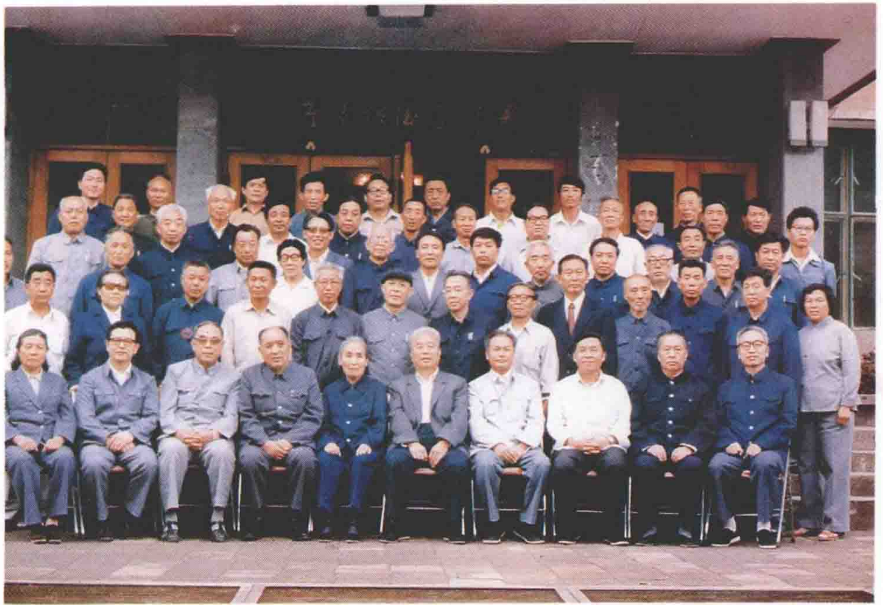
原热河省分行部份老干部修志座谈会合影（1986、9）