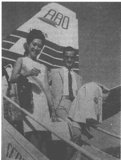
连战夫妇步下飞机

连战除了知礼，也很会读书，20岁就台大毕业，25岁取得美国芝加哥大学外交硕士，29岁拿到芝加哥大学政治学博士，30岁执教于威斯康辛大学、康涅狄格大学。从连战求学历程不难发现，他的智商不低却与外在形象有极大的差异。以他的读书经历，连战应是一位“大智若愚”的政治人物，可是在对手的嘴上却是一位“大愚若智”的阿斗，当令连战为之气结。兼以连不会口出恶言地回骂，久而久之就坐实对手的嘲讽。再者如连战出任国民党主席时代，对手常以连战的姓名做文章，“欢迎国民党连战连败”，或是“安乐公阿斗战”，类似这种恶毒的文字攻击，连战均未正面响应。