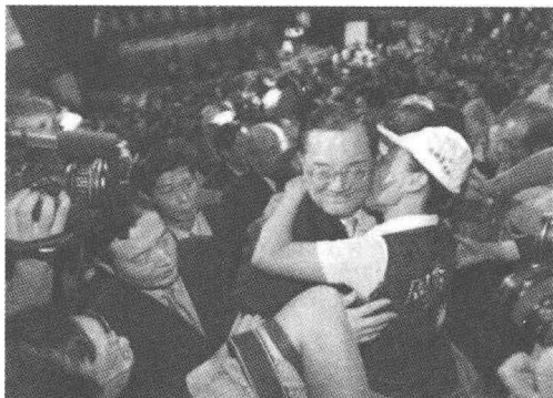
连战受到党员们的热烈拥抱

宋楚瑜——大内高手，政坛金童，蒋经国悉心栽培的青年才俊。在蒋经国去世后的一段时间里，宋楚瑜和李焕之间为了党务系统的主导权，相互斗争，后起之秀的才干也吸引了李登辉的目光。当时的国民党中央党部的权力结构设有一位秘书长：李焕，三位副秘书长：高铭辉——李登辉的心腹、宋楚瑜、马英九。而宋、马又先后出任过经国先生的英文秘书，且两人都形象良好，开明务实，颇受欢迎。