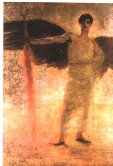
上帝意志的捍卫者 油画