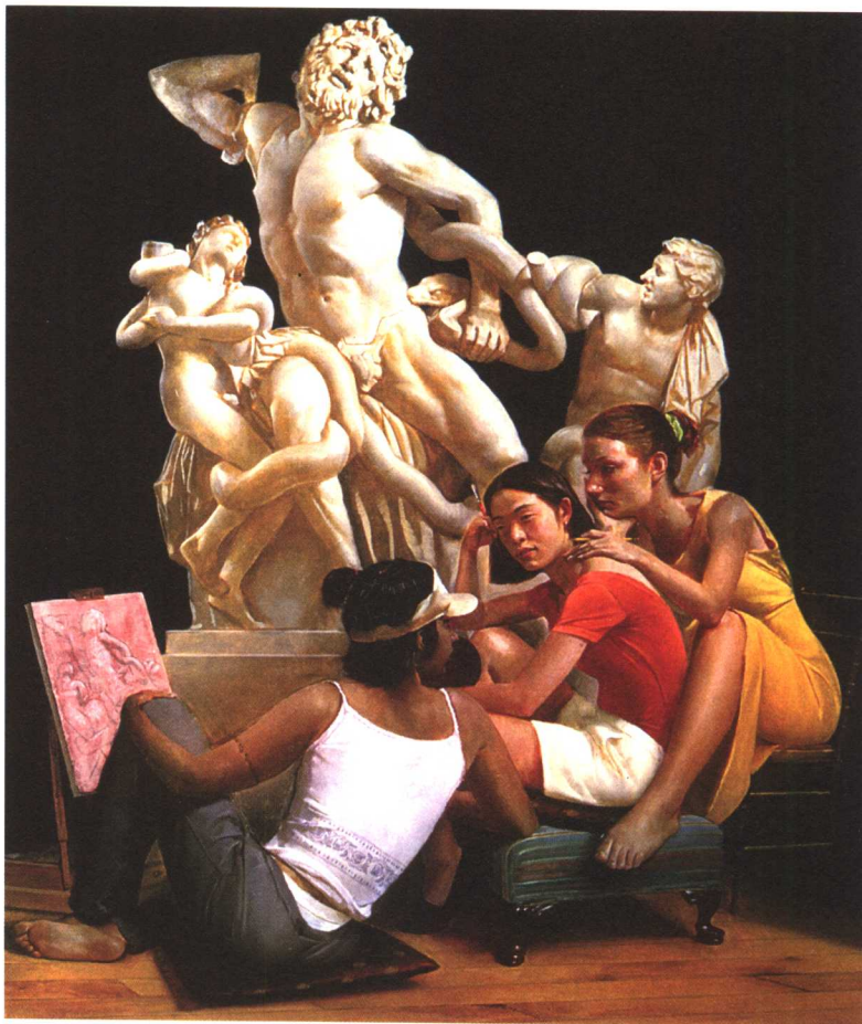
拉奥孔雕像前的学生

终缺乏古希腊人最早表现出来的那种数学基础（当然这也使得这些地方的天文学的成果更加令人赞叹）；古印度的几何学则根本没有理性推导的（Rational）证明，而这恰恰是古希腊人智慧的另一产物，也是力学和物理学的源头；古印度的自然科学尽管表现出非常深刻的观察力，却缺乏有效的实验方法，而这种实验方法，若不深究其远古的起始，那就与近代的实验室一样，基本上都是文艺复兴时期的衍生品；因此医