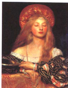
不确知的情感世界 油画