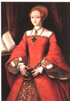
支持新教的伊丽莎白女王 油画