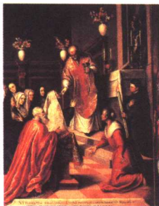
宗教仪式“议员的弥撒” 油画