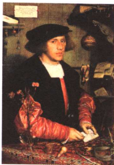
受恩宠的商人 油画