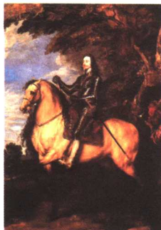
“享乐主义”的查理一世 油画