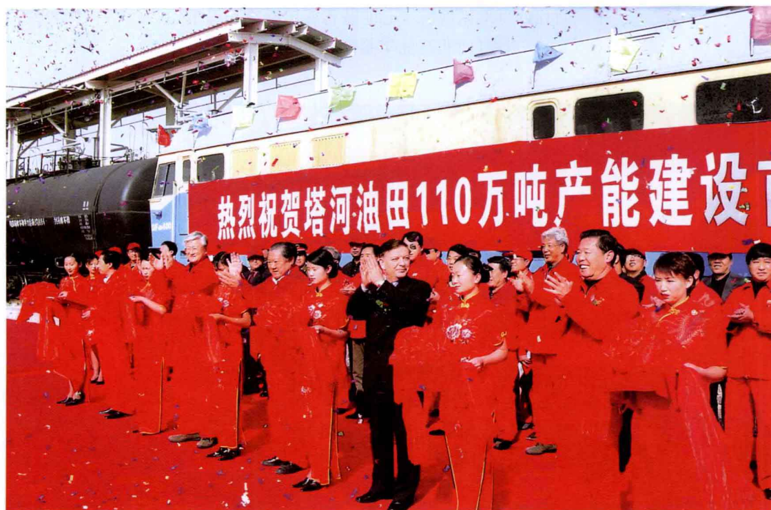
2003年10月15日，中国石化在雅克拉输油末站隆重举行塔河油田110万吨产能建设工程 项目表彰大会暨剪彩仪式，中国石油化工股份有限公司高级副总裁牟书令（前排左六）、 张家仁（前排左四），中国石油化工股份有限公司副总裁王志刚（前排右二），新疆维吾尔 自治区人民政府副主席艾力更·依明巴海（前排右四）出席会议