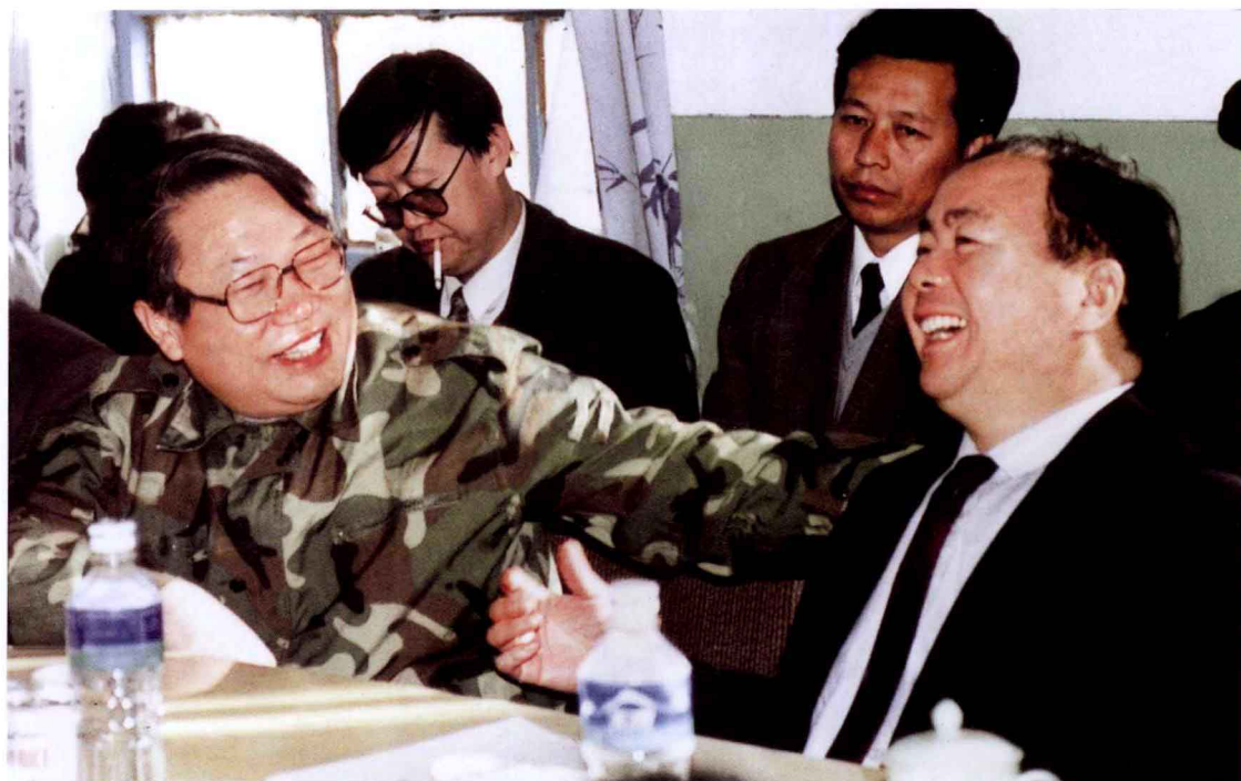
1995年9月，地质矿产部部长宋瑞祥（左）、新疆维吾尔自治区党委书记王乐泉（右）在西北石油地质局塔北前线指挥部检查指导工作（西北石油年鉴资料库）