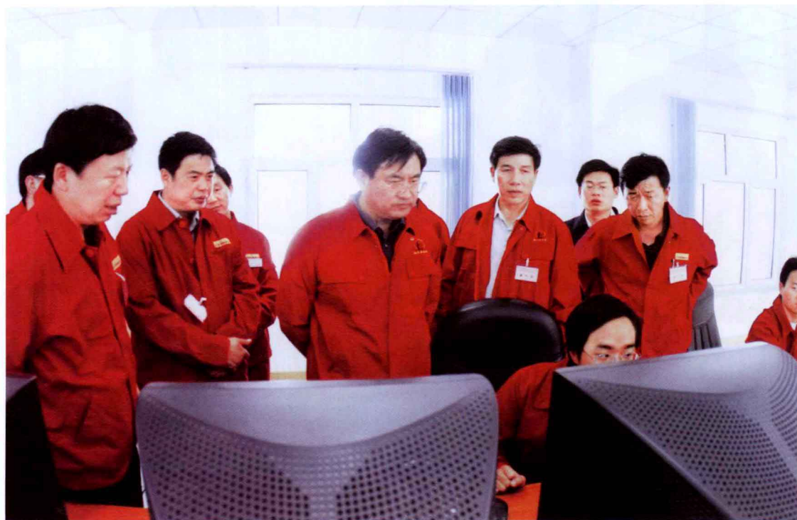
2002年9月，中国石油化工股份有限公司总裁王天普（左三）在塔河油田检查指导工作