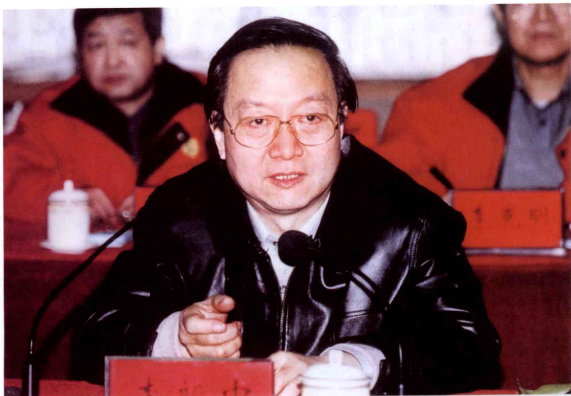
2001年12月，中国石油化工集团公司总经理、中国石油化工股份有限公司董事长李毅中到西北石油局检查指导工作并发表讲话