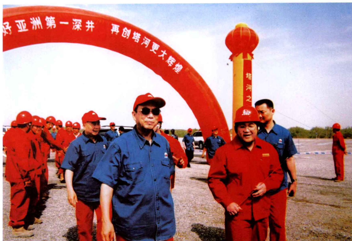
2005年6月18日，中共中央政治局委员、国务院副总理曾培炎（前排左一），中共中央政治局委员、新疆维吾尔自治区党委书记王乐泉（二排左一）在西北分公司经理、西北石油局局长焦方正（前排右一）陪同下，视察塔河油田亚洲第一深井——塔深1井施工现场（西北石油年鉴资料库）