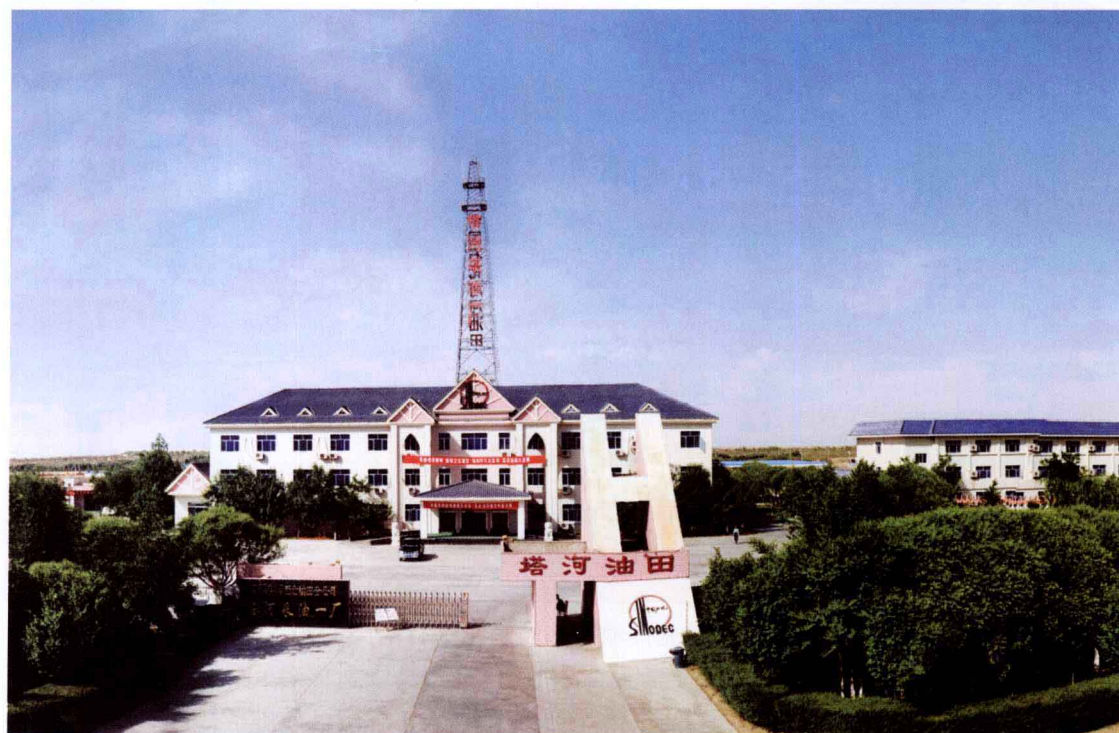
中国石化塔河油田塔河采油一厂厂区（西北石油年鉴资料库，2005年）