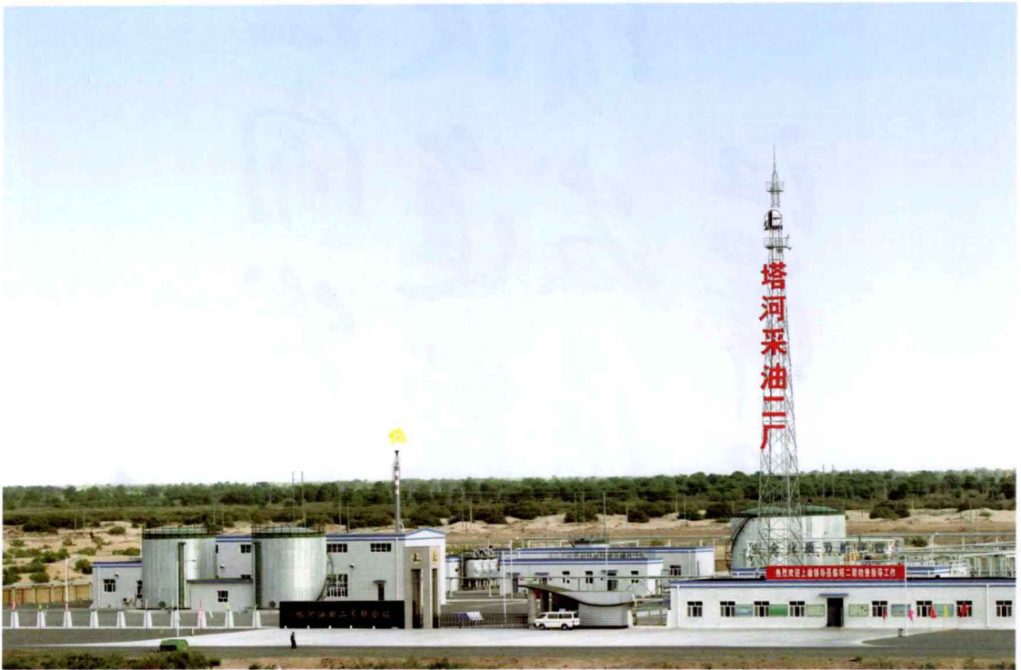
中国石化塔河油田采油二厂二号联合站 (西北石油年鉴资料库, 2005年)