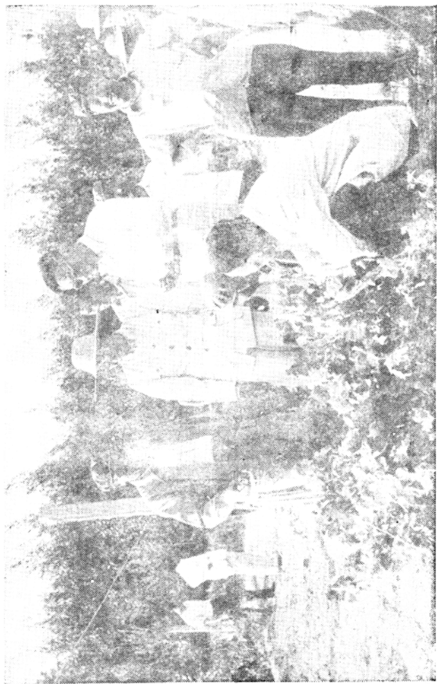
自治区和兵团领导视察垦区