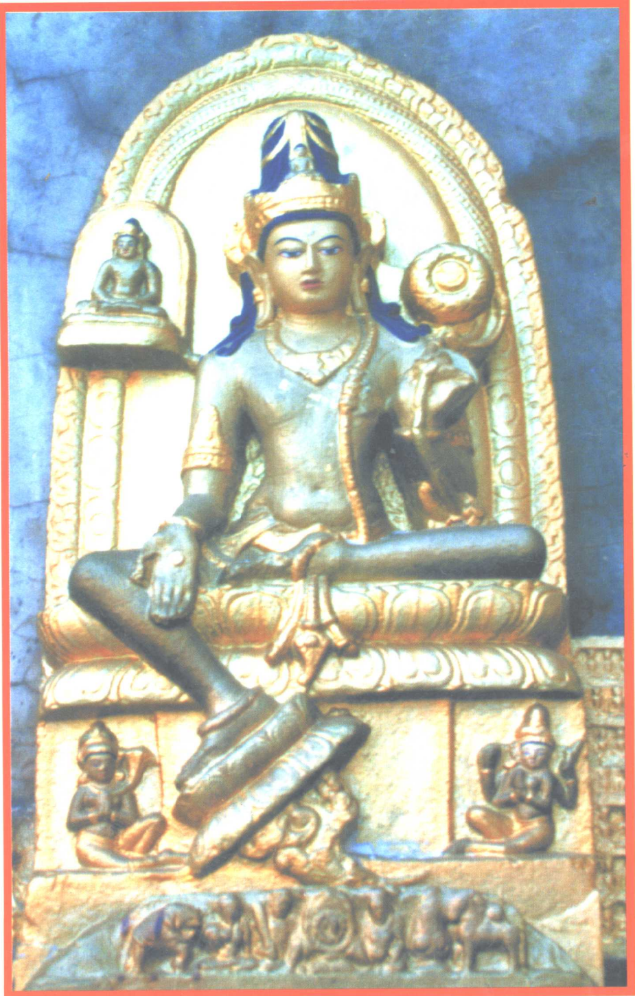
印度金剛座說話之度母像