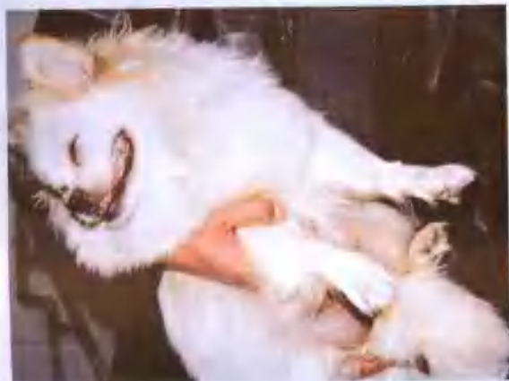
产后低血钙（病情严重）