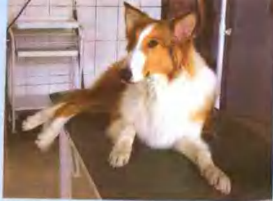
待诊的苏格兰牧羊犬