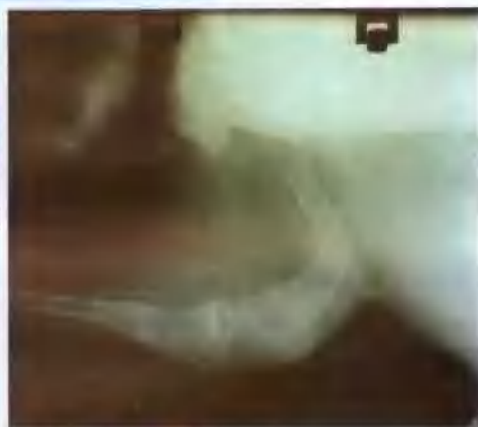
X光片显示股骨颈骨折