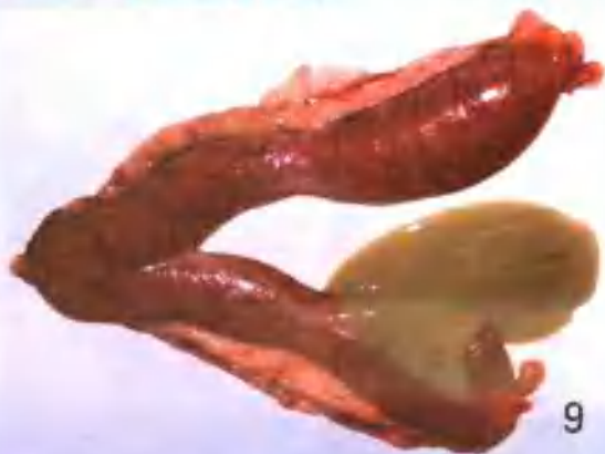
子宫蓄脓 (死后剖检, 子宫内充满灰白色脓汁)