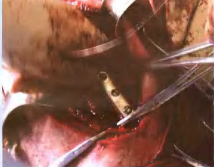
装好骨折下端的螺钉