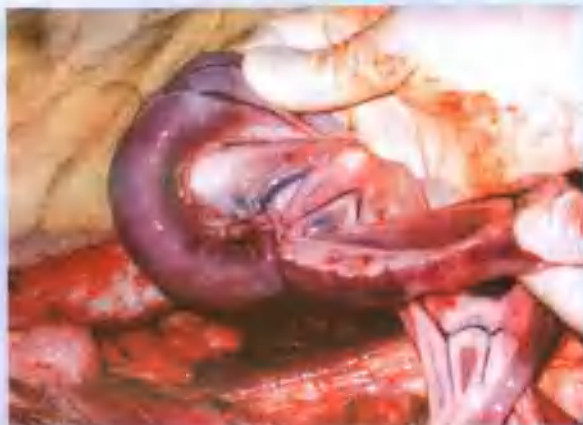
肠套叠 (进行手术治疗)