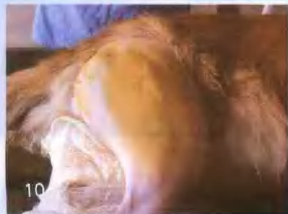
右后肢内侧和外侧 大面积剃毛、消毒， 准备手术