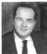
法国总统希拉克的亲笔致函：