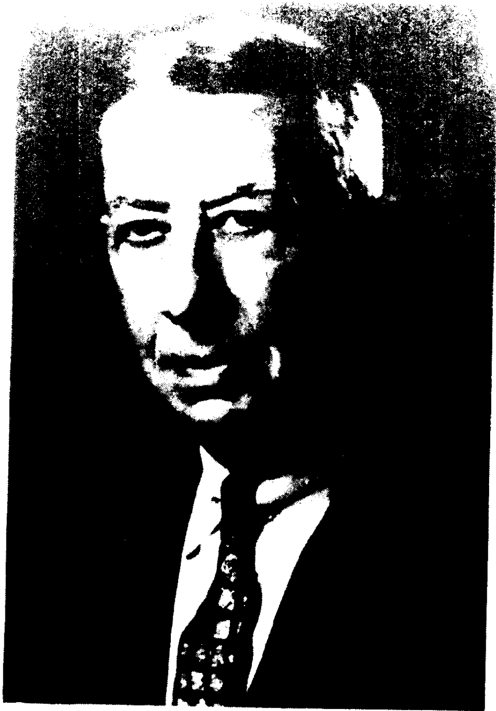
R · H · 蒙哥马利