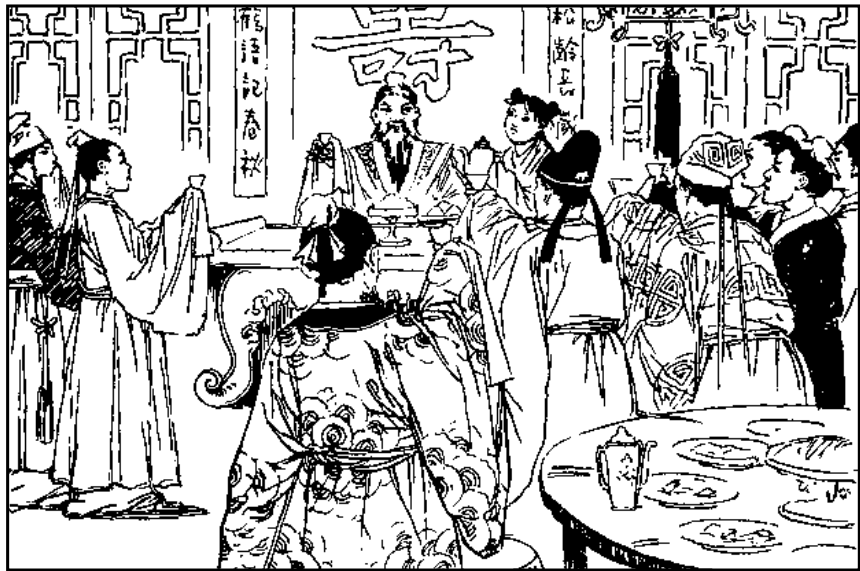
6 屋里正厅是寿堂，灯烛交辉，瑞气盈盈。当中坐着一位白发老人，两旁摆设筵席。宾客们不时向老人敬酒谈笑。