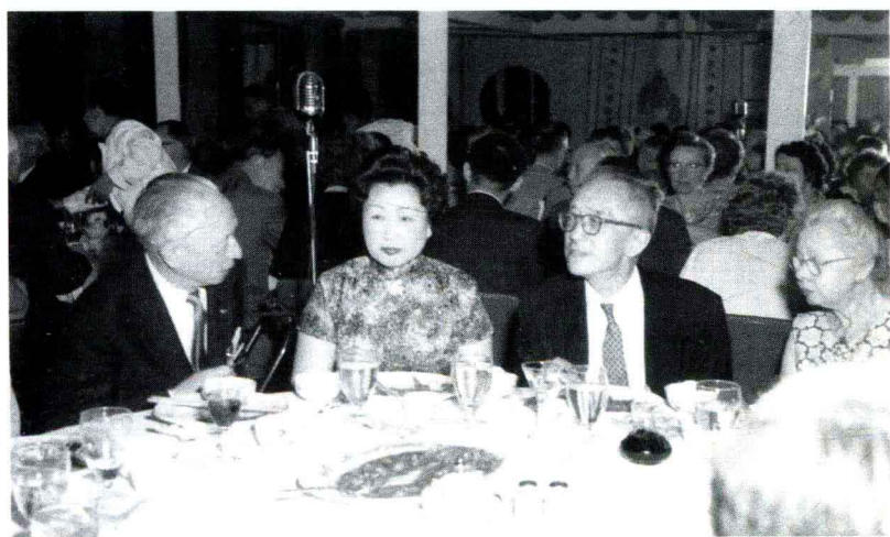
上：1939年胡适（右）与美国财政部长摩根索（中）、陈光甫（左）合影。