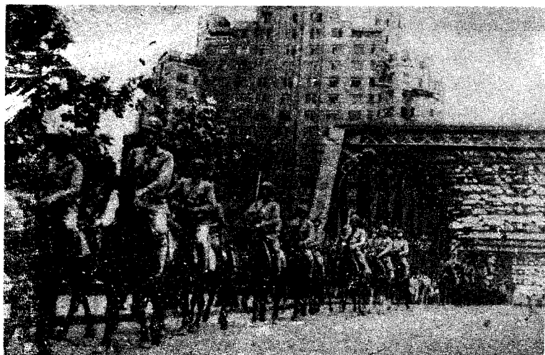
人民解放军骑兵部队进入上海市区。