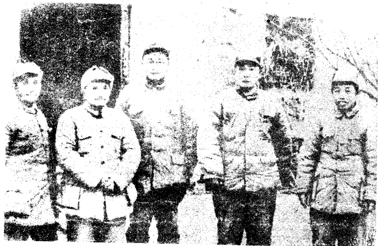
渡江战役总前委成员合影。从左至右：粟裕、邓小平、刘伯承、陈毅、谭震林。