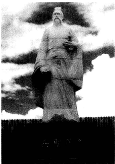
山东广饶孙子塑像

握作战全过程中敌我双方不断变化着的各种具体情况。这是贯穿全书的一个基本思想，也是这部兵书的精髓所在。《孙子兵法》所以强调知彼知己，目的是为了先胜。二是进行“庙算”。所谓“庙算”就是中国古时候凡国家遇及战事，都要告于祖庙，设于明堂，是一种分析形势，制订战略的仪式。《孙子兵法》中说：“夫未战而庙算胜者，得算多也；未战而庙算不胜者，得算少也。”“庙算”是中国历史上第一个战略概念。孙子认识到，是不是很好地进行战前的战略分析，直接影响到战争胜负。因此，要根据掌握的敌我双方的情况，立足于已有的物质条件和战争潜力，从道、天、地、将、法等方面进行系统比较，分析形势，对军事行动产生的各种可能性进行充分估计，制订预案，做出