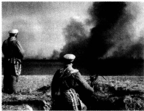
美国把战火烧到鸭绿江畔

在第一次海湾战争的地面作战阶段，多国部队广泛实施了空地一体、大纵深机动和非线式作战，首先把大批人员和战争物资空降到伊拉克幼发拉底河地区，迅速切断了伊拉克退路。在地面战争的头两天，美军第101空降师动用300余架直升机采用“蛙跳式”机降战术，突入伊纵深430公里；第24机步师在47小时之内跃进了300公里。在正面进攻的同时，还以小分队在敌后广泛开展了特种作战。多次出现敌我犬牙交错，前后难以区分等情况。因此，军队指挥必须是动态的，以适应战场情况和作战行动的不断变化的需要。指挥员和指挥机关必须快速反应，以前所未有的机动灵活，准确把握战场形势，审时度势，顺势而动，寻求主动，使军队指挥符合不断变化着的客观实际，从而使战局不断朝着有利于己的方向发展。