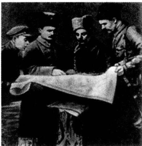
伏罗希洛夫等在研究作战方案

军队指挥是指挥者对所属军队的作战准备与实施，所进行的运筹和调度活动。通常而言，军队指挥属于领导活动的范畴，因此具有一般领导活动的共性特征。即同样是领导者（指挥员和指挥机关）率领和引导下属（被指挥者）为实现一定的目标，共同作用于作战对象的行动过程。要理解军队指挥，需要把握以下含义。