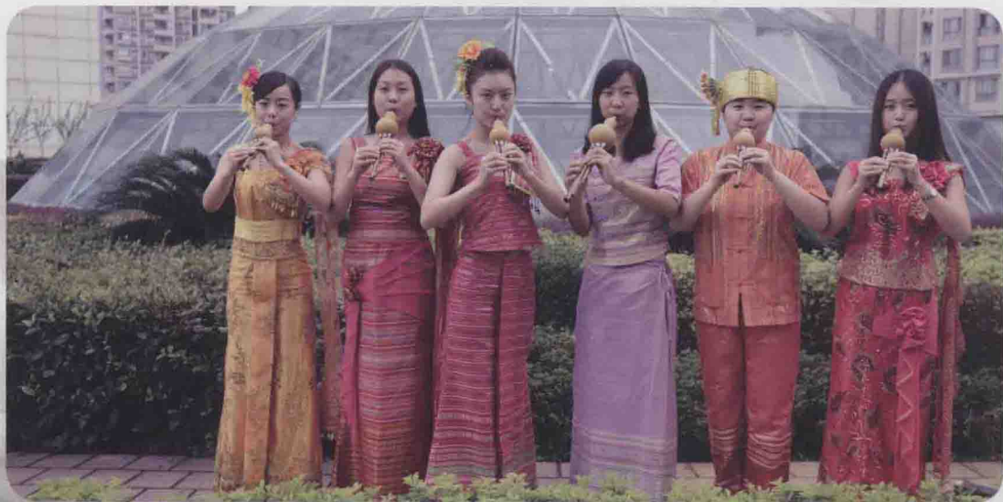
葫芦丝演奏的组合训练