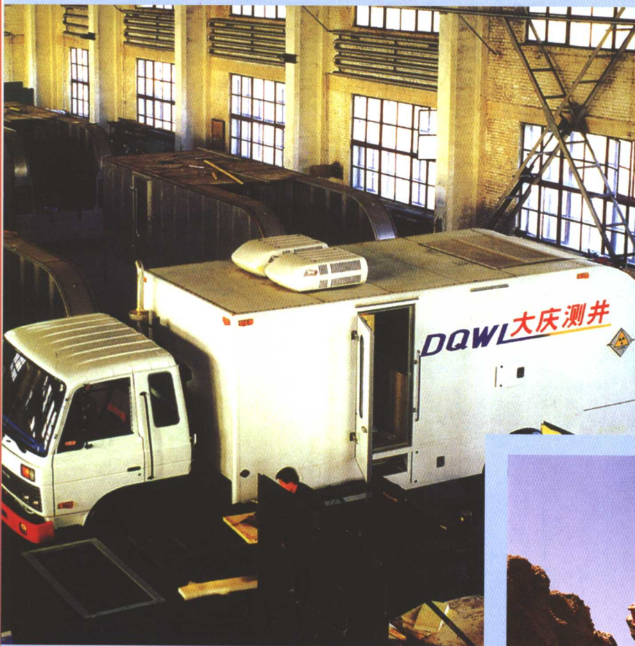
隶属于大庆石油管理局石油装备制造集团的汽车改装厂是黑龙江省最大的专业汽车改装厂

大庆石油管理局职工队伍始终坚持“三老四严”，做到“五项要求”，承建了一批精品工程，叫响了“大庆”品牌，树立了良好的信誉，展示了石油人良好的形象。目前，已有18支作业队在国外7个国家施工，电泵、射孔弹、抽油机等产品已出口到了哈萨克斯坦、英国等16个国家和地区。2003年，油田外部市场收入达到74.62亿元，已成为全局重要的经济来源。