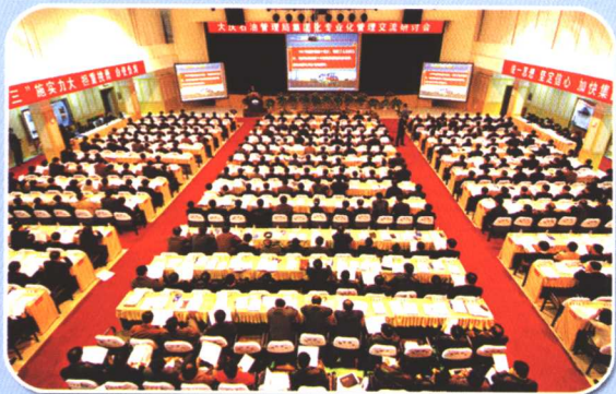
大庆石油管理局集团化专业化管理交流研讨会大会现场

部署了创新体制、调整结构、强化经营、开拓市场、稳步发展、由大做强“六大战略”任务。确立了二次创业新的战略组合。从逐步推动企业全面实施国际化经营的高度，把外部拓展战略作为主导战略，把合作双赢战略、多元发展战略作为基础战略，把低成本战略、人力资源开发战略、科技创新战略和企业文化战略作为保障战略，努力使企业管理进入到战略管理的新阶段。对推进二次创业的精神动力、队伍建设、环境建设以及政治保证进行了明确。这些战略规划，为大庆石油管理局实现持续高效发展提供了科学的战略保障，有力地推进了企业发展。