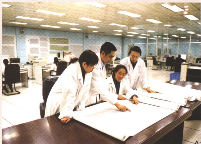
公司科研人员勇挑重担、奋力攻关，努力解决事关油田勘探发生生死攸关的“瓶颈”问题，打牢创建百年油田的基础。

当前，大庆油田有限责任公司把完善水驱技术，发展聚驱技术，攻克复合驱油与特低渗透层、复杂油藏开发技术，探索聚驱后三次采油新技术作为重中之重，建立了组织机构，确定了管理流程，实施了课题制管理，制定了激励措施，开展了10项重大现场试验，为创建百年油田的伟大实践和确保国家石油战略安全提供强大的科技保障。