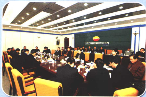
关于企业发展的会议讨论现场

大庆石油管理局为了科学高效地推进新时期的各项工作，围绕探索企业的持续发展之路，不断强化战略管理，在实践中形成了《大庆石油管理局二次创业指导纲要》，对事关油田二次创业的重大战略性、原则性、方向性问题进行了科学阐述，为企业发展提供了理论指导；明确了二次创业的战略方针和奋斗目标，以科学发展观为指导，以“发扬大庆精神，搞好二次创业，实现持续发展，再铸企业辉煌”为战略方针，最终把大庆石油管理局逐步建成国内一流、具有较强国际竞争能力，以石油工程技术服务为主，加速向新经济领