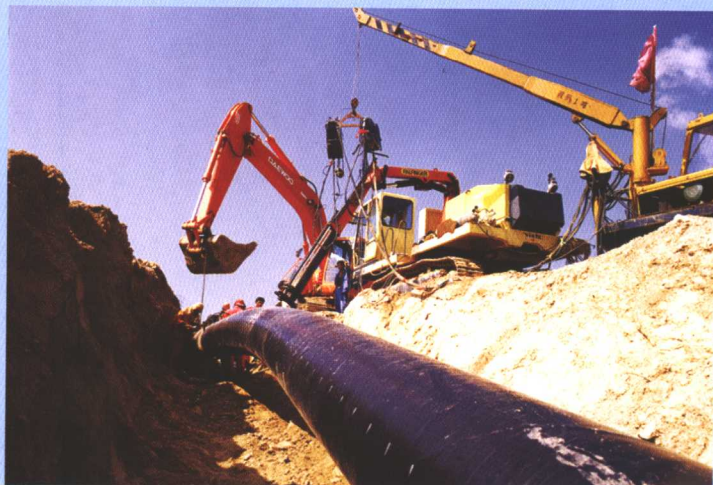
西气东输管道工程施工现场