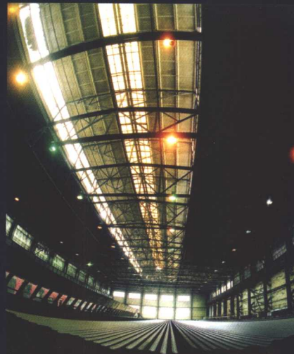
通钢集团型钢连轧生产线