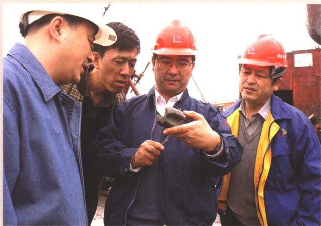
大庆油田主力油层采收率已突破50%大关。图为科研人员深入现场进行技术指导，努力实现油田采收率最高。

大庆油田的开发建设史，就是一部科技进步史。40多年来，油田科技在开发实践中不断取得新的进步，油田开发在科技进步推动下不断取得新的进展。正是由于水驱技术、聚驱技术的不断发展完善，才实现了连续27年年产原油5000万吨以上高产稳产和现阶段的持续有效开发。事实证明，每一次资源储量的增长和油田采收率的提高，无不闪耀着科技的光芒，科技为大庆油田发展做出了决定性的贡献。