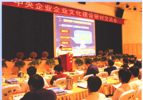
大庆石油管理局在中央企业企业文化建设研讨交流会上做经验交流

不断加强企业文化建设，为企业发展提供精神动力。大庆石油管理局在企业文化建设上，始终坚持以继承发扬大庆精神、铁人精神为核心，与时俱进，不断赋予其新的时代内涵。工作中积极教育引导干部职工牢固树立“为市场提供最好服务，为企业创造最佳效益”的企业经营价值观，严格遵守坚持“三老四严”，做到“五项要求”的职工行为规范，培养和树立正确的价值理念和行为导向。特别是抓住铁人王进喜同志诞辰80周年和中央企业企业文化研讨交流会在大庆召开的有利契机，开展了一系列活动，在全局范围内进一步掀起了继承弘扬大庆精神、铁人精神的热潮，展示了新时期大庆石油职工良好的精神风貌，几年来，大庆局党委和大庆局先后被中组部授予“全国先进基层党组织”，被国资委评为“中央企业先进基层党组织”、“中央企业先进集体”，被中国企业文化促进会评为“中央企业企业文化建设十大杰出贡献单位”等荣誉称号。