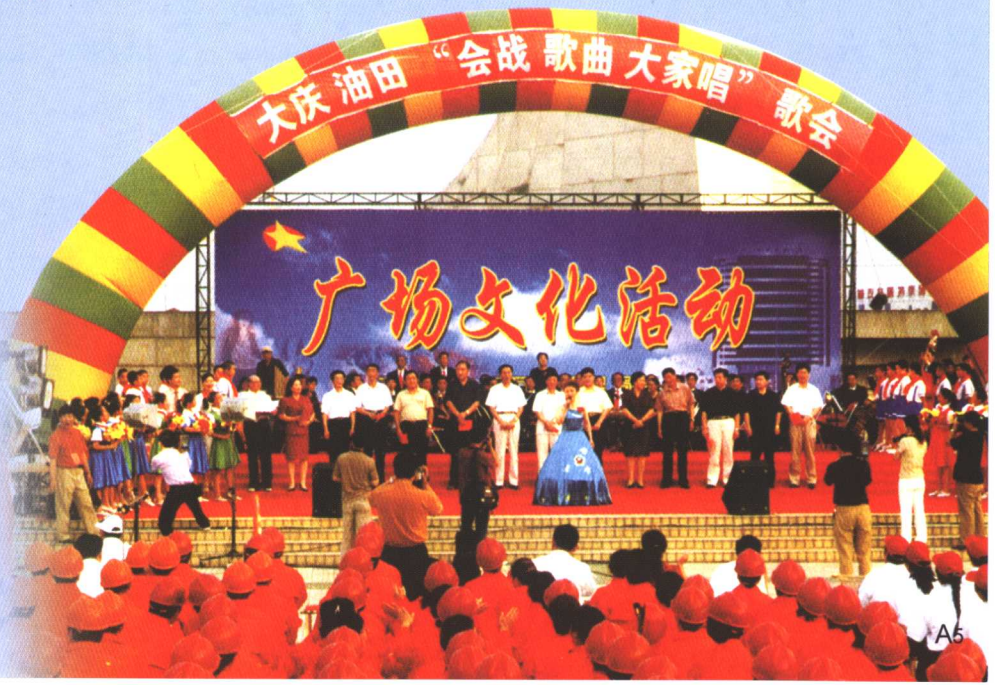
管理局领导与职工一起进行文化娱乐活动