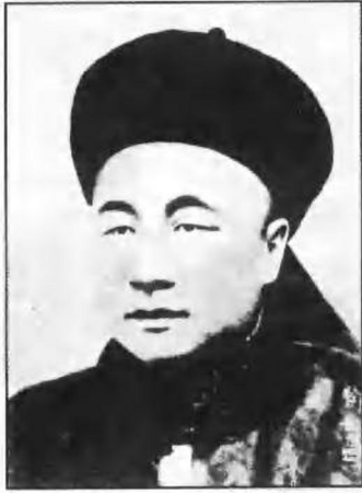
“致远”号管带(舰长)邓世昌。