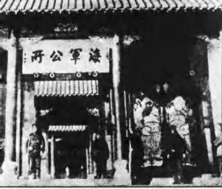
刘公岛上的北洋海军提督衙门。