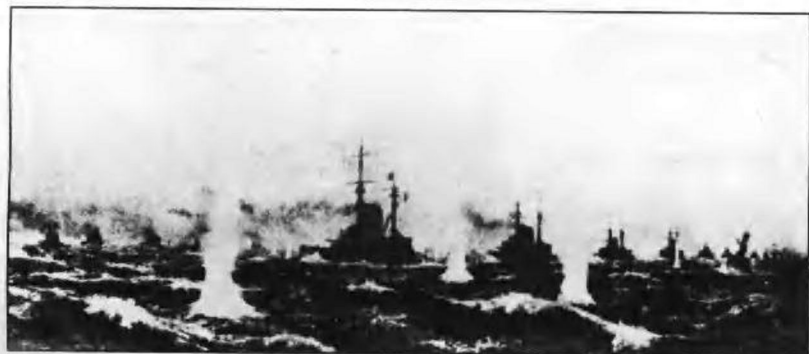
中日舰队黄海大战。