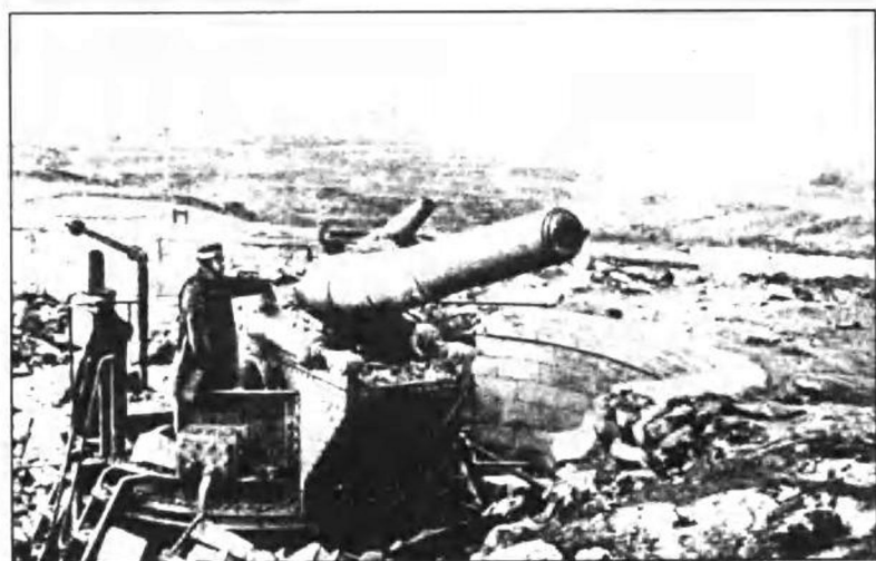
威海卫炮台被日军侵占。