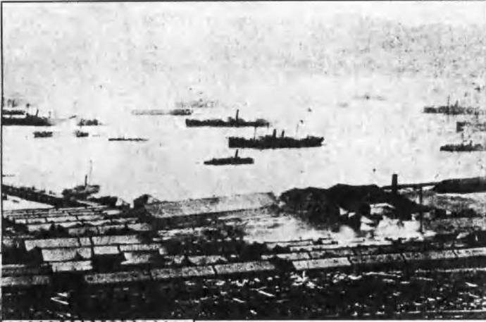
停泊在威海卫刘公岛前的中国军舰。