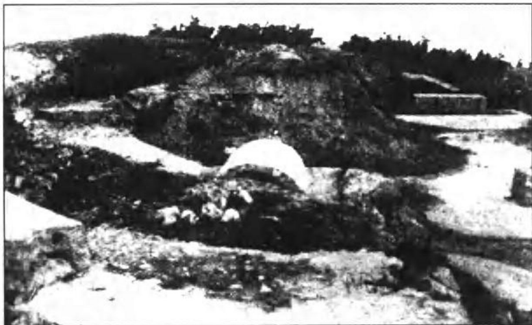
被日军炮毁后的刘公岛炮台