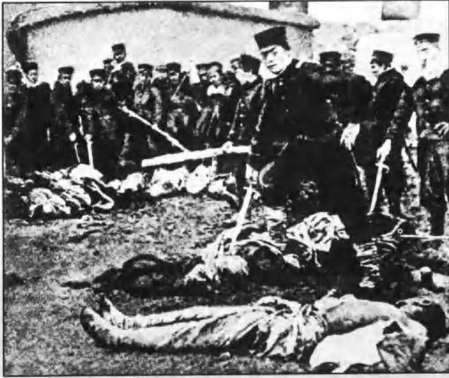
日军在旅顺的暴行。