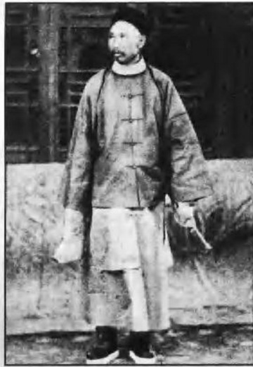
北洋海军提督丁汝昌。