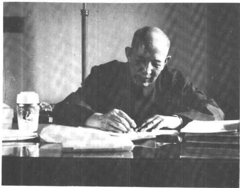
一九八三年春，李维汉带病撰写回忆录。