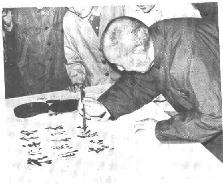
一九八一年五月李维汉在上海参观中共代表团驻沪办事处纪念馆时题词。