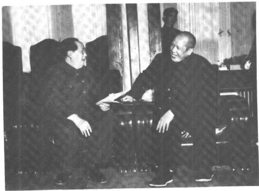
一九五一年毛泽东、李维汉亲切交谈。