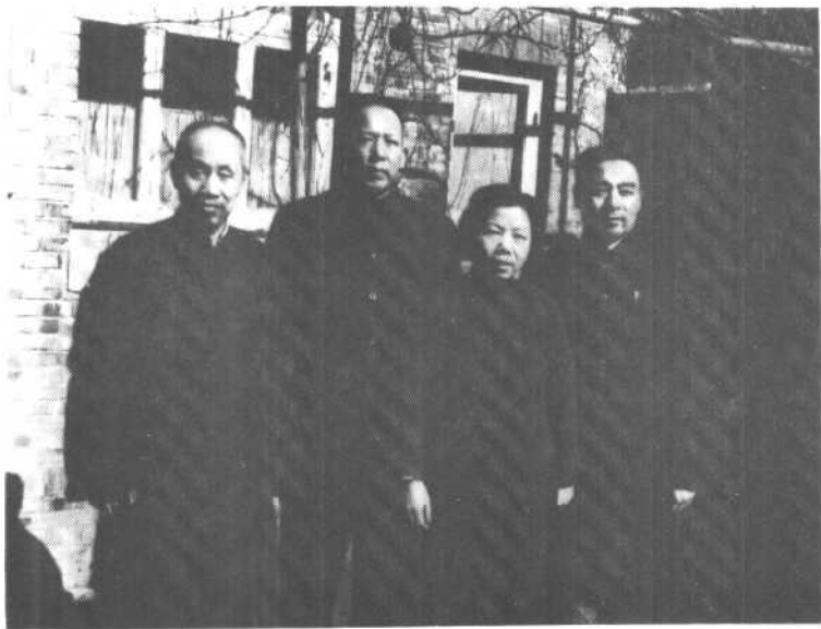
在南京中共代表团驻地李维汉(左二)和周恩来、董必武、邓颖超合影。