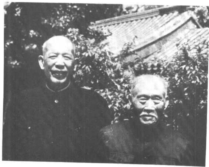
一九六六年李维汉(左)、徐特立合影。