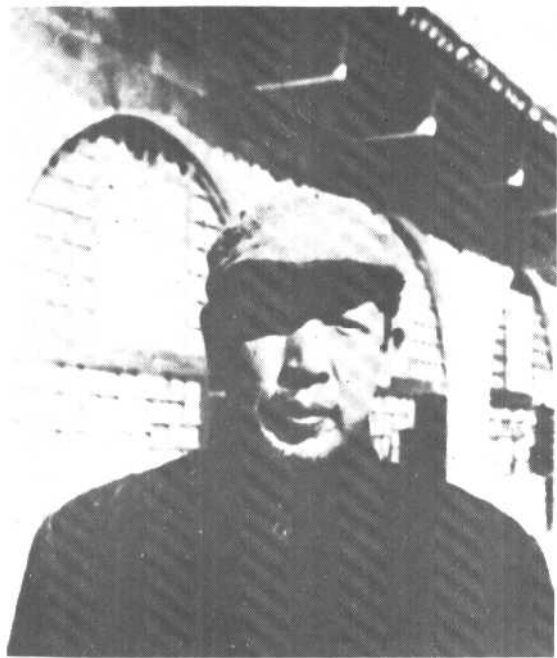
李维汉一九四四年在延安