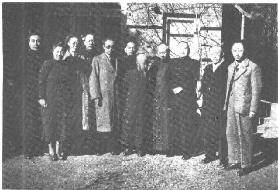
一九四六年十一月十七日，参加国共谈判的中共代表团撤回延安时与民主同盟负责人留影。左起：周恩来、邓颖超、罗隆基、李维汉、张申府、章伯钧、沈钧儒、董必武、黄炎培、张君勱、王炳南。