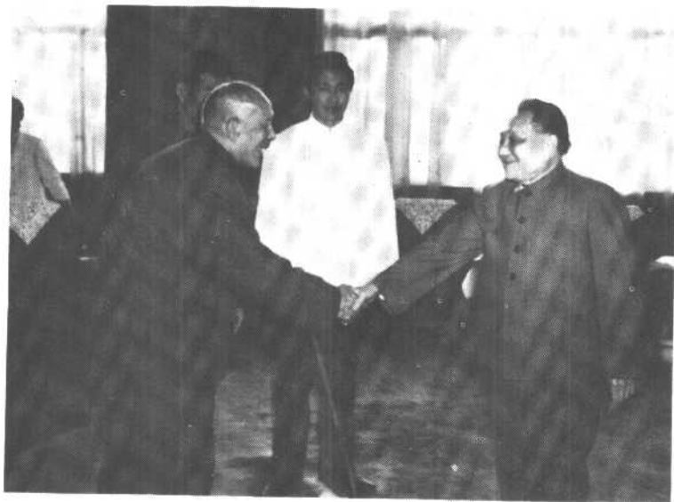
一九八二年十一月，李维汉在出席全国政协会议期间和邓小平亲切见面。