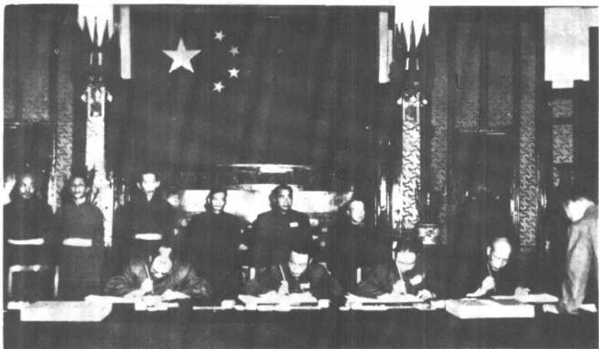
一九五一年五月二十三日，关于和平解放西藏办法的协议签字仪式在北京举行。中央人民政府首席全权代表李维汉（右一）在协议上签字。