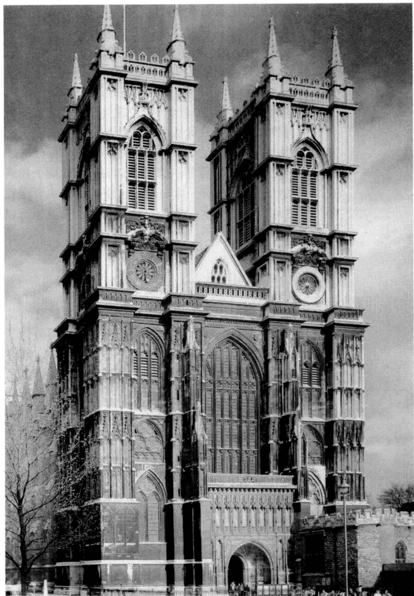
伦敦威斯敏斯特大教堂