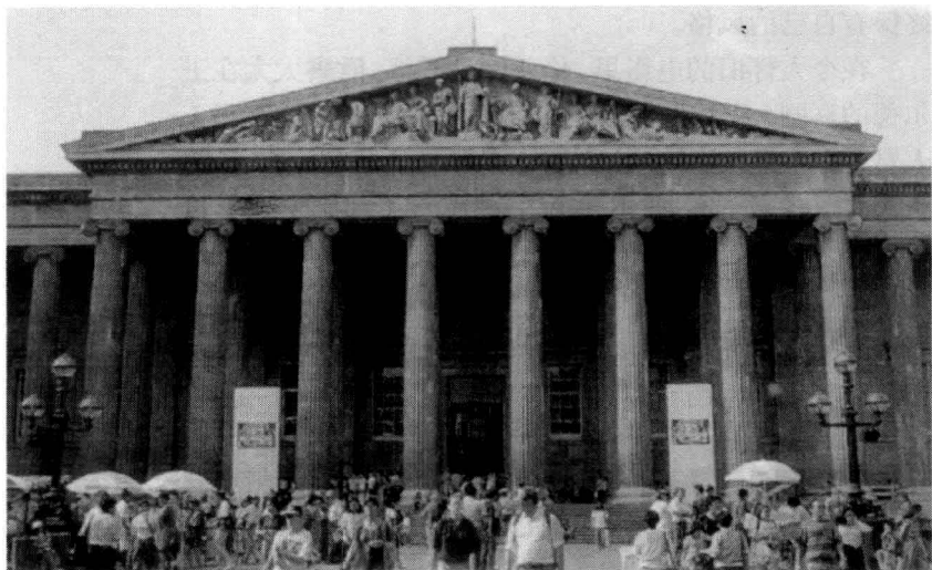
人头攒动的大英博物馆

伦敦——雍容成熟的雾都 当一个人厌倦伦敦时 他也厌倦了生命 因为生命所能给予的一切 伦敦都有