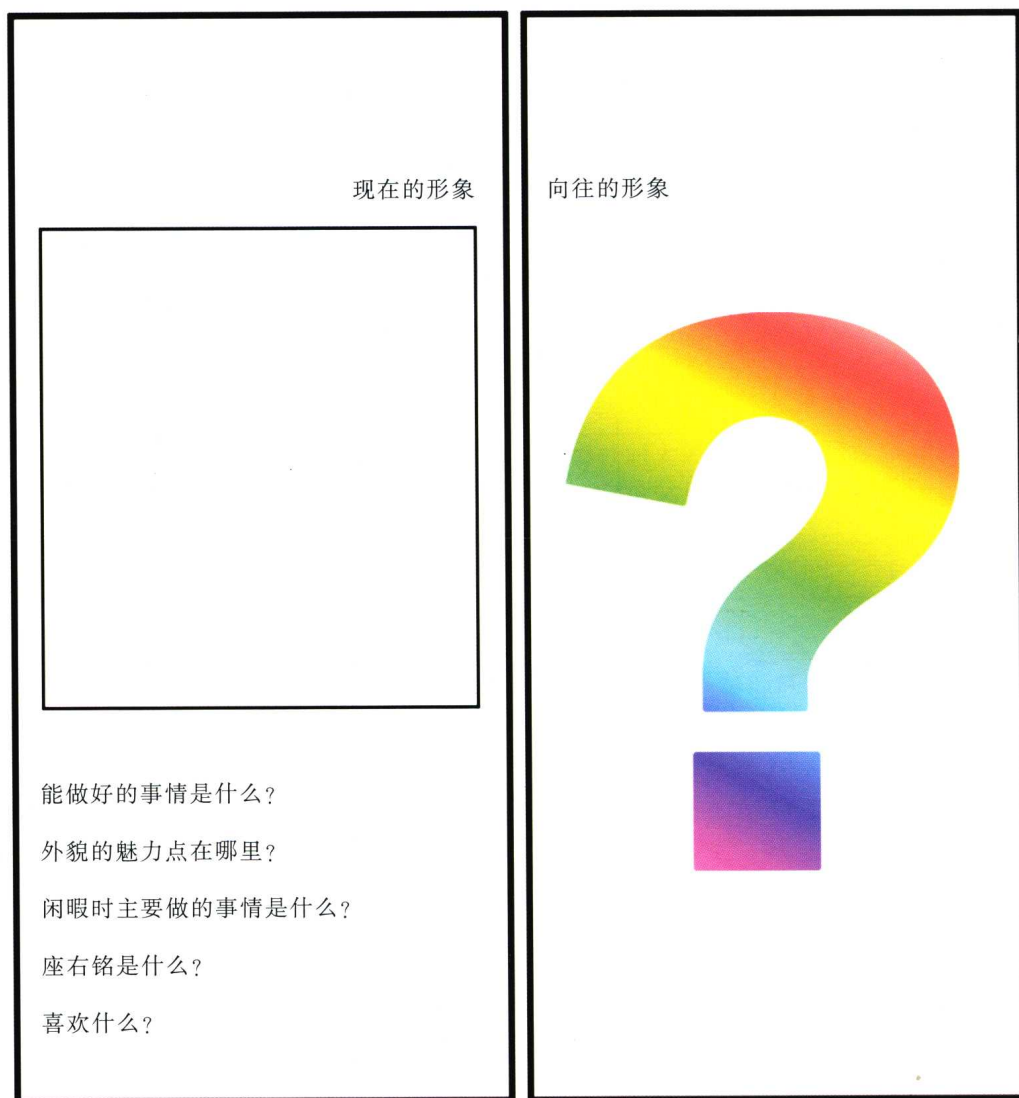
图 1-3 目标形象