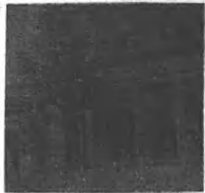
(图四) 原中车路宽城子邮政局