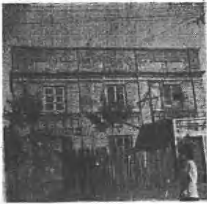
(图三) 原白俄小学校址