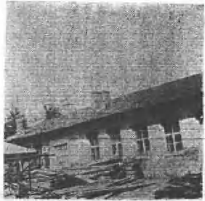
(图二) 原俄国驻二道沟将校营一角