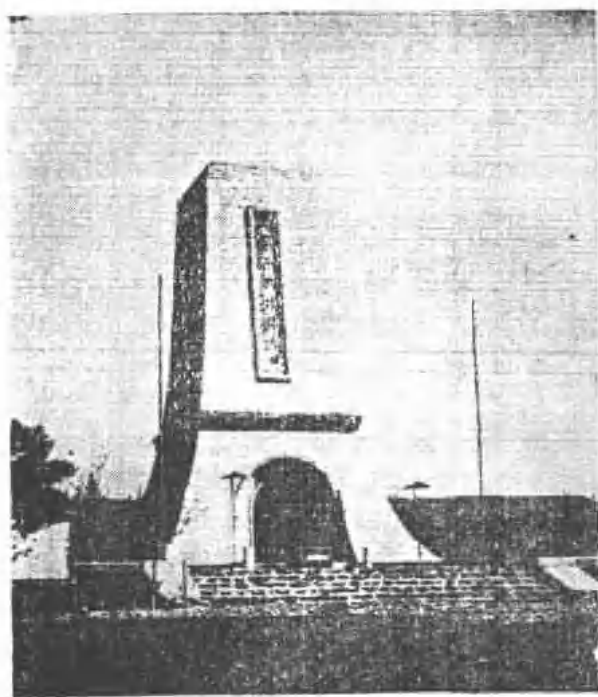
(图六) 原宽城子战绩纪念碑