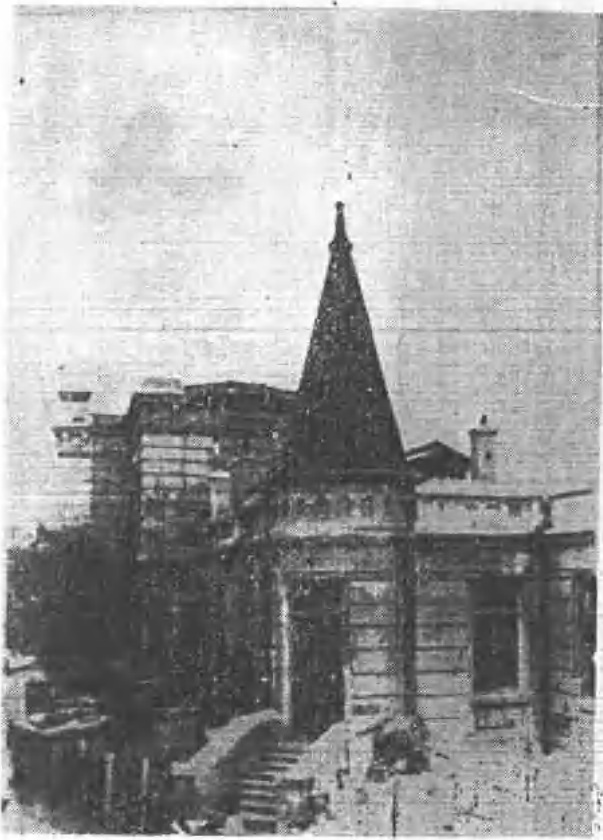
(图一) 原俄国驻长春领事馆