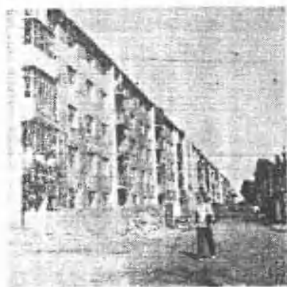
(图七) 新建职工宿舍一角