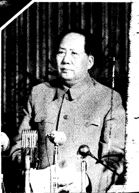
1957年2月，毛主席亲自主持召开了最高国务会议，并在这次会议上发表了《关于正确处理人民内部矛盾的问题》的重要讲话。