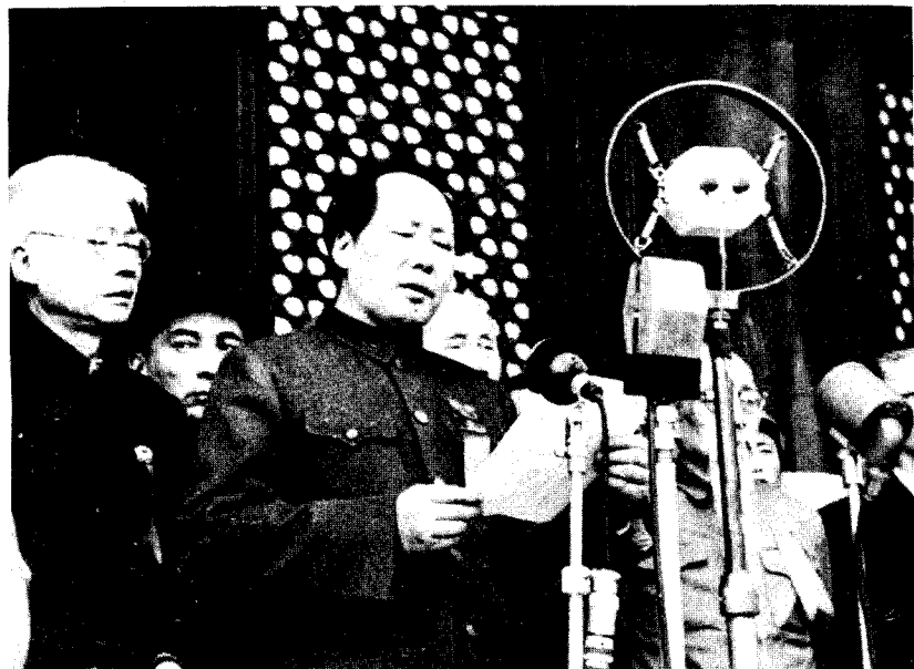
开国大典。1949年10月1日，毛泽东在天安门城楼上宣读中央人民政府公告。