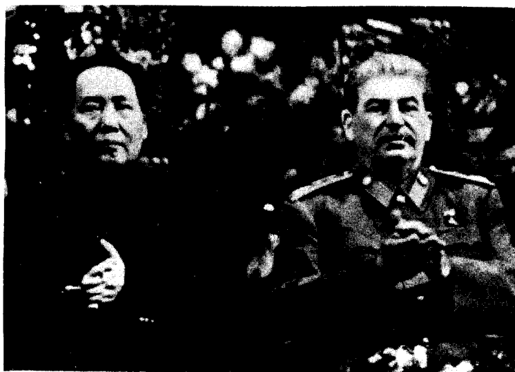
1949年12月，毛泽东在莫斯科庆祝斯大林70寿辰时和斯大林的合影。