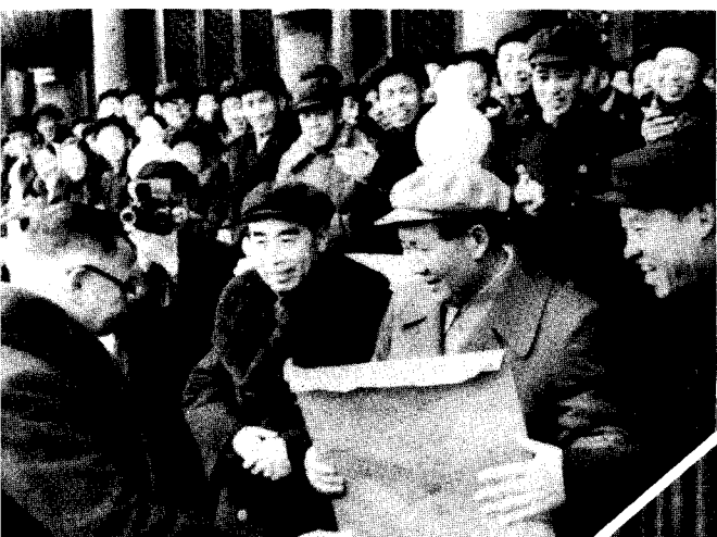
1956年1月15日，北京市各界在天安门广场举行庆祝社会主义改造胜利联欢大会。图为工商界代表向毛泽东献报喜信。