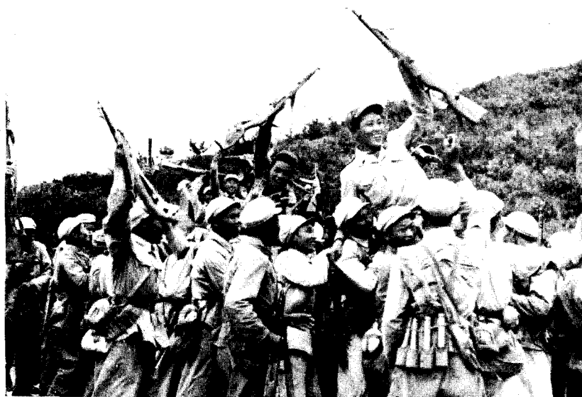
胜利会师。在朝鲜战场上，中朝两国部队胜利会师的情景。