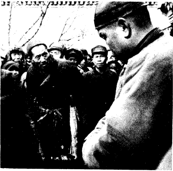
1949年在北京市郊某村， 农民召开大会斗争恶霸地主。