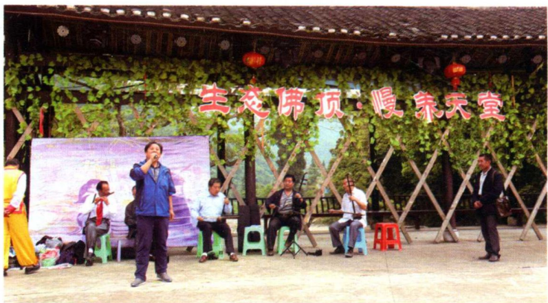
与尧上民族村艺人联欢