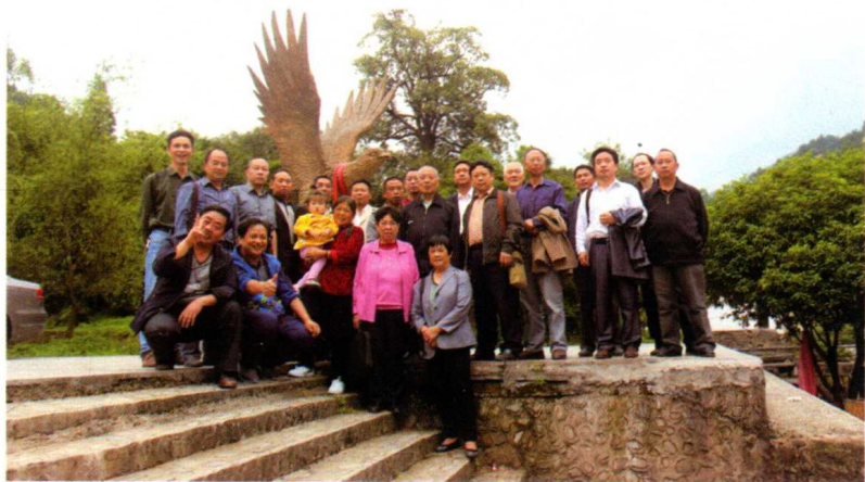
赴石阡尧上村学习考察