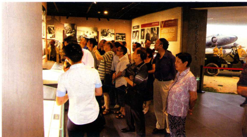
参观芷江受降纪念馆