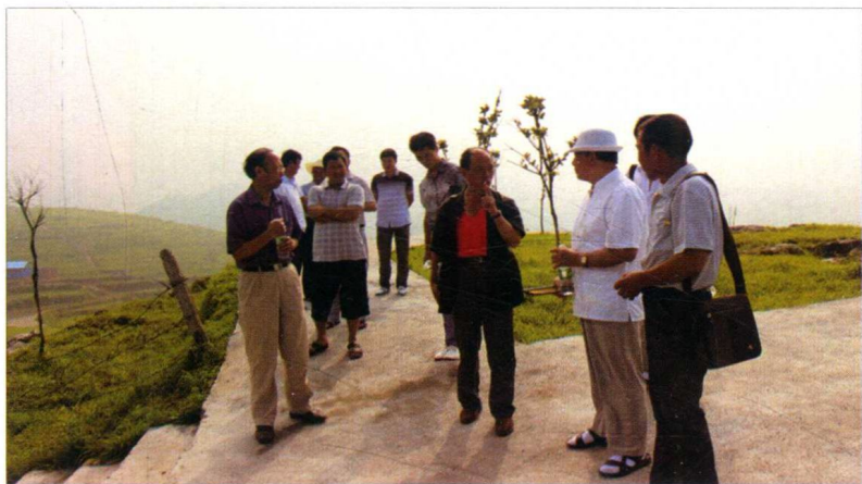
赴盘石调研畜牧业