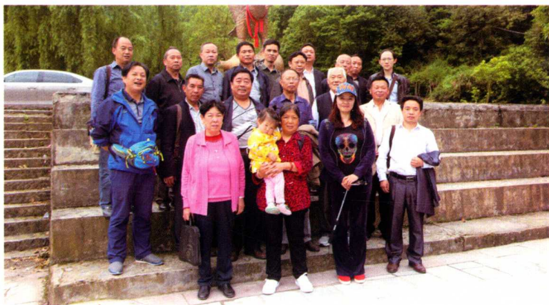
赴石阡尧上村学习考察