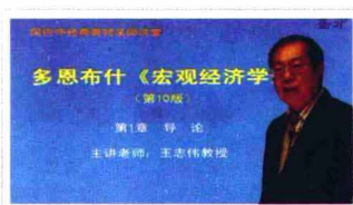
北京大学王志伟教授