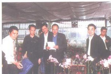
漳州市委书记郑立中在县、镇领导陪同下到南靖兰花园视察和研究兰花产业。