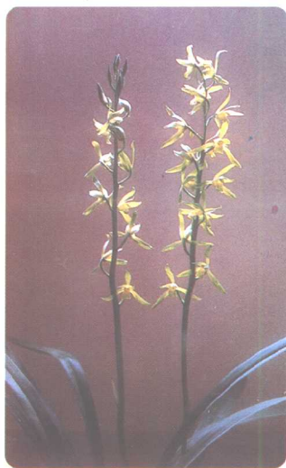
南靖名品——山城绿墨兰