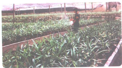
兰花的原产地——和溪