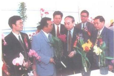
中共福建省委常委、秘书长黄瑞霖（右三）在市、县领导陪同下观看兰花。