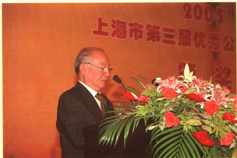
李道豫在颁奖典礼上致辞