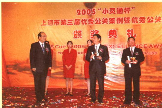
优秀公关人士特别奖获得者