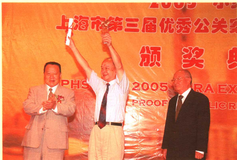
优秀公关案例特别奖获得者