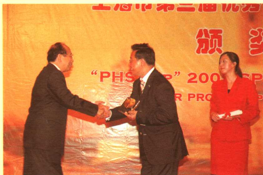
优秀公关人士特别奖获得者