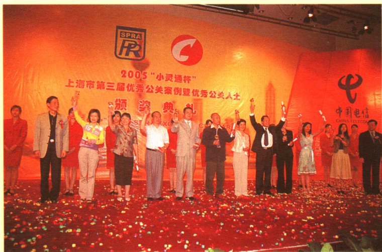
优秀公关案例金奖获得者