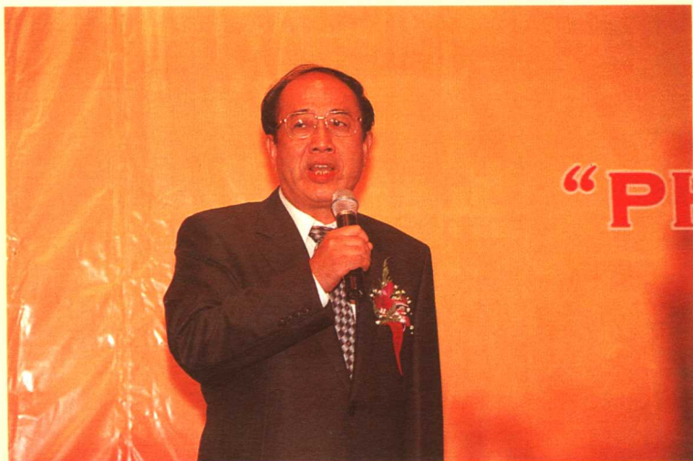
赵启正在颁奖典礼上讲话