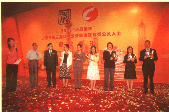
优秀公关人士卓越奖获得者