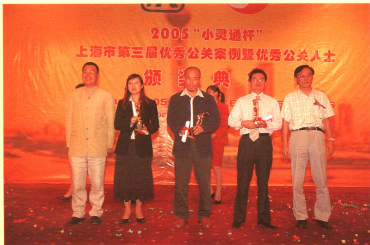
优秀公关案例最佳创意奖获得者