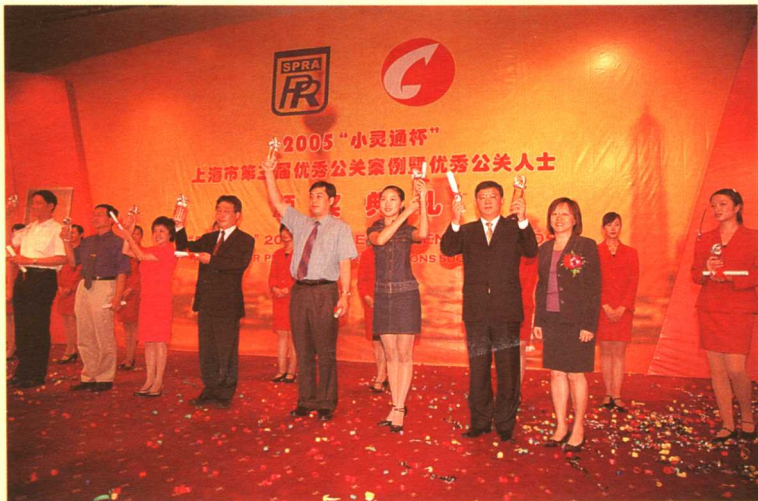
优秀公关案例银奖获得者