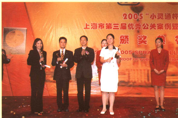
优秀公关案例最佳实施奖获得者