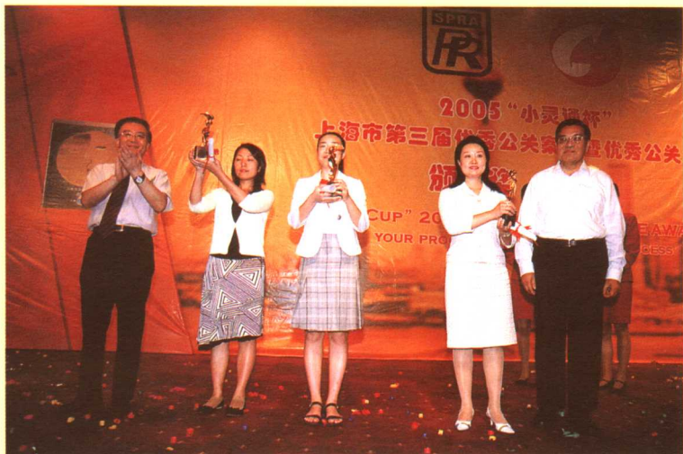
优秀公关案例公众参与奖获得者