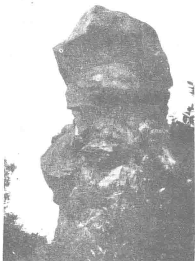
巴岳山极顶——天灯石