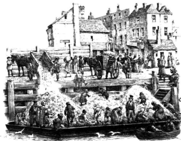
19世纪初的伦敦脏乱不堪，使霍乱传播成为可能。其后英国政府下决心发展公共卫生事业，有效控制了霍乱等疾病的传播。

1829年夏季，霍乱又开始复活，向东、向西、向北沿着贸易路线和宗教朝圣路线迅速地向欧洲的人口密集中心推进。1830年，霍乱传到了莫斯科；1831年春天，它到达了波罗的海沿岸的圣彼得堡，从那儿它又轻易地跳到芬兰、波兰，然后向南进入匈牙利和奥地利。差不多同一时间，柏林出现了霍乱病人，紧接着汉堡和荷兰也报告出现了疫情。