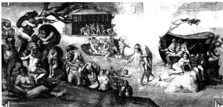
壁画《大洪水》。看着这些由于受磨难而表情滞重的人物向前行进，我们几乎能感觉到上帝愤怒时的恐怖气氛。

印第安人则流传着这样一个关于史前大洪水的传说。这个传说说的是神仙巴里卡卡来到一个村庄，由于村人正在庆祝节日，所以没有人注意衣不蔽体的他，更别说给他食物吃了。只有一位年轻姑娘出于同情，给了他一点儿食物。巴里卡卡为了感激她，就跟她说这座村庄5天之后将会毁灭，请她赶紧找个地方躲起来，并叮嘱她不要让其他人知道这件事情。之后，巴里卡卡就用风暴和洪水瞬间毁灭了整个村庄。