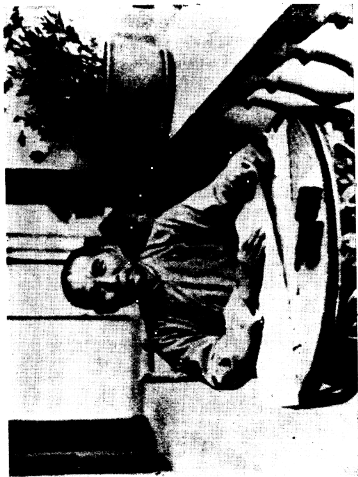
在大元帥府辦公室