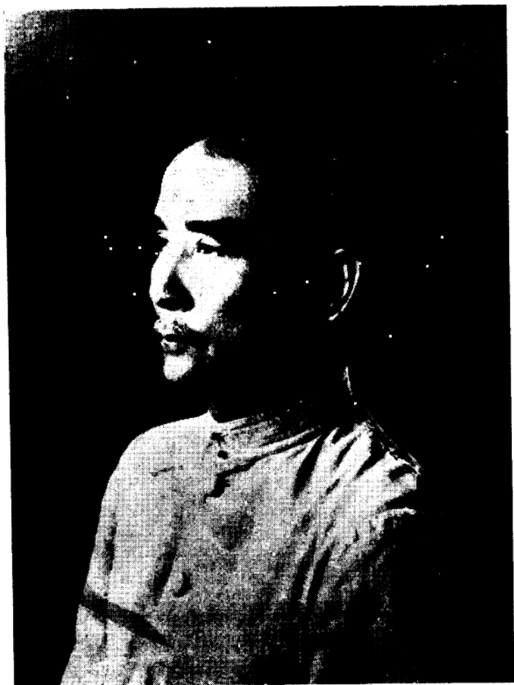
一九二四年在广州