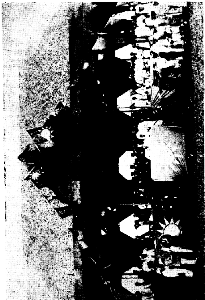
一九二四年六月二十九日在广州检阅军队、警察及商团军