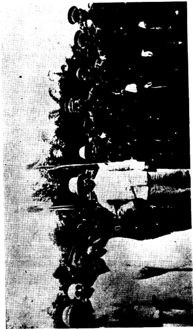
与廖仲恺在视察军队